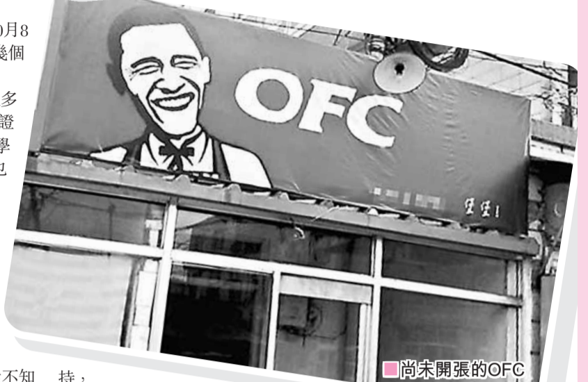
尚未開張的OFC餐館，招牌上赫見美國總統奧巴馬頭像。京華時報

10月4日，微博上關於OFC(奧巴馬炸雞)的話題頗為火熱，這是北京一家尚未開張的餐館的名字，奧巴馬頭像是其招牌。為了這家名不見經傳的小餐館，肯德基中國特意發表聲明，稱「OFC」與其沒有任何關聯，對方已經侵犯肯德基的商標權。 ■《京華時報》