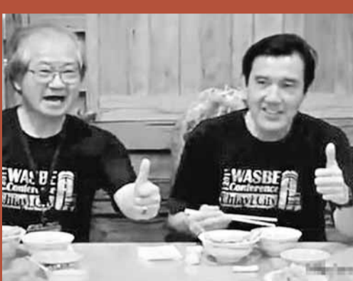
馬英九的競選廣告「向前衝」，是首支以馬英九為主題的廣告，他亦與副手吳敦義(左圖中)同台登場。