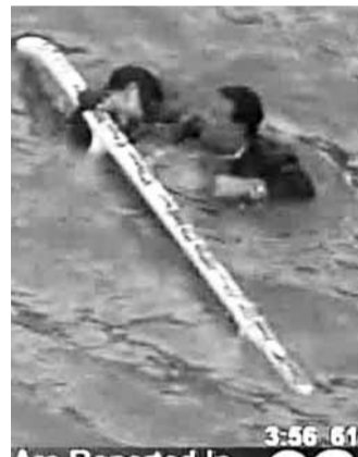
乘客抓緊直升機底部，情況驚險。

前日在紐約曼哈頓聯合國總部附近，發生一宗導致1死4傷的直升機墮河意外，死者是一名從澳洲到當地慶祝40歲生日的女子，她被困直升機內沉入15米深河底，事發後90分鐘才被撈出水面。意外中另外有3名傷者送院，其中兩人傷勢嚴重，當局正調查意外成因。