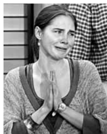
諾克斯見記者時情緒激動。

美國女大學生諾克斯坐牢4年後，日前脫罪，前日踏足家鄉西雅圖，難掩心情激動。路透社自從意大利上訴法院推翻其謀殺英國室友的罪名後，被英國傳媒稱為「天使魔鬼」的諾克斯獄中遭遇也受關注。諾克斯在獄中寫的日記，就記載着她被男獄警質問性生活「套料」，當局更告知她被驗出染上愛滋病毒，因而身心俱疲。