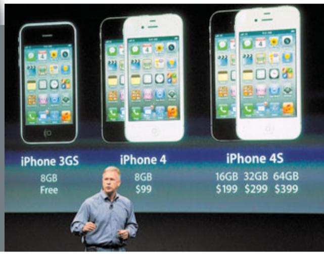
產品營銷副總裁席勒介紹iPhone4S，可見4S與之前的版本外型相同。