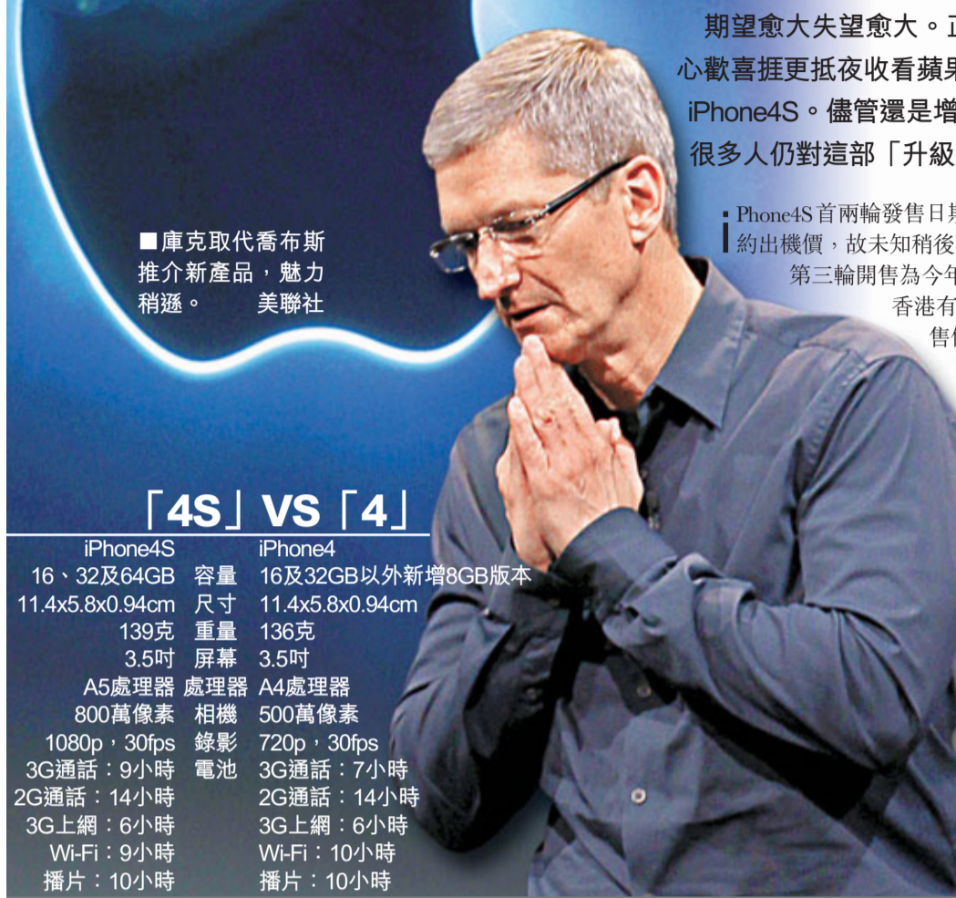
庫克取代喬布斯推新產品，魅力稍遜。