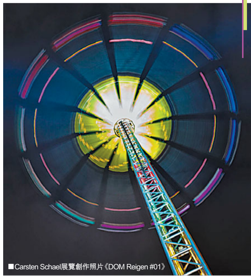
Carsten Schael展覽創作照片《DOM Reigen #01》

除了一系列照片，展覽將同時展出全新的Jules Audemars系列。此攝影展所呈現的非凡藝術典雅不但反映愛彼錶對藝術、工藝及鐘錶製作的不朽精神，更同時秉持品牌的社會承諾，於地區內積極推廣藝術與人才。