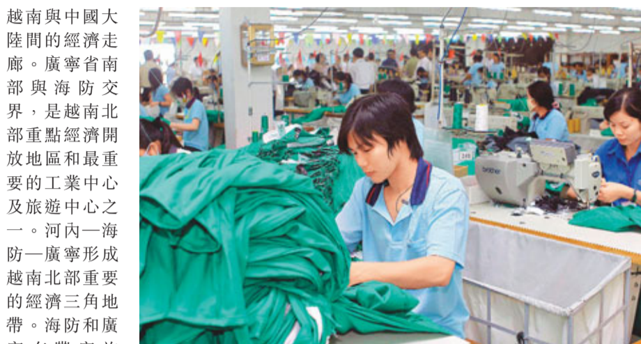
越南積極吸引外商投資，有望成為新的「世界工廠」。圖為胡志明市一家製衣廠車間。

越南與中國大陸間的經濟走廊。廣寧省南部與海防交界，是越南北部重點經濟開放地區和最重要的工業中心及旅遊中心之一。河內—海防—廣寧形成越南北部重要的經濟三角地帶。海防和廣寧有豐富旅遊、經濟、轉運潛力，位居越南中國經濟合作走廊的重要地理位置。接連廣寧省下龍灣和海防路線，對發展越南北部沿海區域經濟有著正面且積極的作用。海防港70%貨櫃運載到廣寧省各口岸。