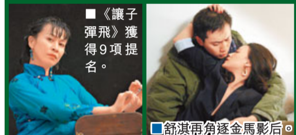
舒淇再角逐金馬影后。