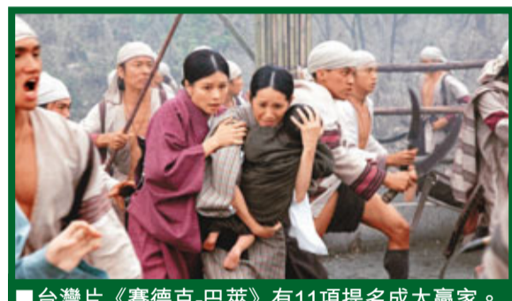
台灣片《賽德克·巴萊》有11項提名成大贏家。

另外，去年以電影《艋舺》榮膺金馬影帝的阮經天，今年接下金馬電影大使重任，他主演的金馬形象宣傳片正式曝光。該短片由侯孝賢執導，出動老班底打造富含「流光似影，百年瞬間」寓意的短片。