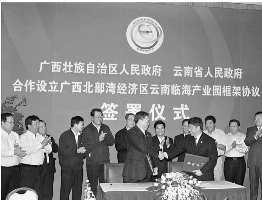
■泛珠活動日前簽署第一個合作協議,雲南省將在廣西北部灣經濟區建設雲南臨海產業園。圖為簽字儀式。

馬飆在座談會上稱,正在建設中的雲桂鐵路竣工後,昆明至南寧可實現三小時直達,三個半小時可實現貨物出海,北部灣經濟區與雲南橋樑堡建設可互為促進。李紀恒表示,廣西處太平洋西岸,雲南與印度洋相近,國家正積極推進雲南橋樑堡建設,海港陸港相連,相信將會大力促進雲南與鄰近地區經濟的共同發展。