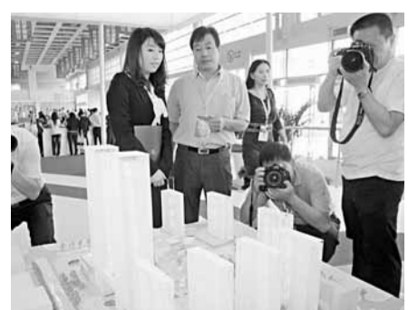
■廊坊蘇寧廣場的規劃展引起媒體們的關注。

專業論壇,交流推廣綠色生態城市建設的新理念、新技術、新觀點,為全國各地構建了合作交流的平臺,必將進一步推進生態城市探索與實踐,引領城市未來發展。