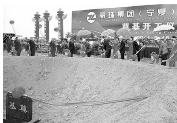
■麗珠集團(寧夏)醫藥產業園一期工程預計投產後可實現年銷售收入逾5億元。