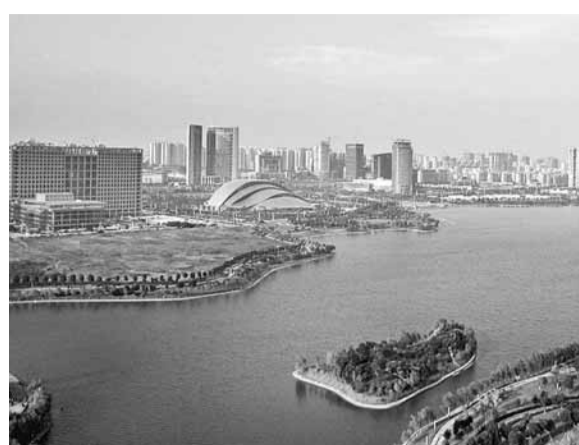
■合肥現在的市域已突破1萬平方公里。圖為城區新貌。

「十一五」期間,合肥GDP規模從900多億元增長到3,700多億元,在安徽省的經濟比重達到22%,多項經濟指標增速位居全國省會城市第一位。未來五年內,合肥將力爭實現GDP達7,000億元,財政收入1,100億元。吳存榮表示,合肥是安徽的省會,也體現着安徽的實力。合肥將加快建設現代化濱湖大城市,打造現代化新興中心城市,發揮核心輻射帶動作用,為建設美好安徽多做貢獻。其中,中心城區將重點發展現代服務業和新興業態,濱湖新區將拓展建設、提升品