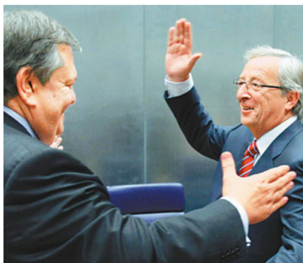
希臘財長韋尼澤洛斯(左)與歐元集團主席容克會面。

歐元區17國財長前晚結束會議，延後決定是否向希臘提供80億歐元(約821.7億港元)救助貸款，預料將延至月中再議。希臘財長韋尼澤洛斯稱，希臘不應該成為歐債危機的「代罪羔羊」。歐元集團主席容克強調，不會讓希臘違約或離開歐元區，但他警告歐洲銀行將需承受更大虧損，作為希臘獲得第二筆援助的條件之一。