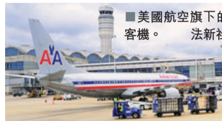
美國航空旗下的客機。

美國航空的母公司AMR，預料將連續第4年錄得虧損。外界傳聞AMR可能要申請破產保護，加上AMR近日突然出現機師退休潮，令破產傳聞火上加油。AMR在過去2個月內已有超過200名機師退休，遠超平均每月的12人，有分析指原因是機師怕取