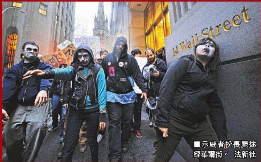
示威者扮喪屍途經華爾街。