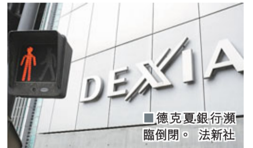
德克夏銀行瀕臨倒閉。

比利時及法國合資銀行德克夏銀行(Dexia)由於持有大量歐洲主權債務尤其希臘的國債，正瀕臨倒閉，股價昨日一度急挫37%。繼2008年金融海嘯期間出手拯救後，比法兩國政府昨稱「必要時會干預」，再度出手拯救該行。比利時內閣正商討將德克夏業務分拆減赤，以免對歐洲銀行業造成骨牌效應。