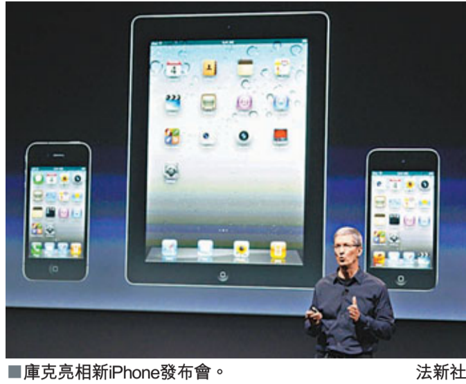
庫克亮相新iPhone發布會。

蘋果迷引頸以待的時刻快將來臨！蘋果公司於香港時間凌晨1時在加州總部舉行新iPhone發布會，新總裁庫克勇躍上陣。外界不但留意他能否繼承「蘋果教主」前總裁喬布斯的魅力，亦關注新一代iPhone會否帶來驚喜，與Google的Android產品繼續爭一日之長短。