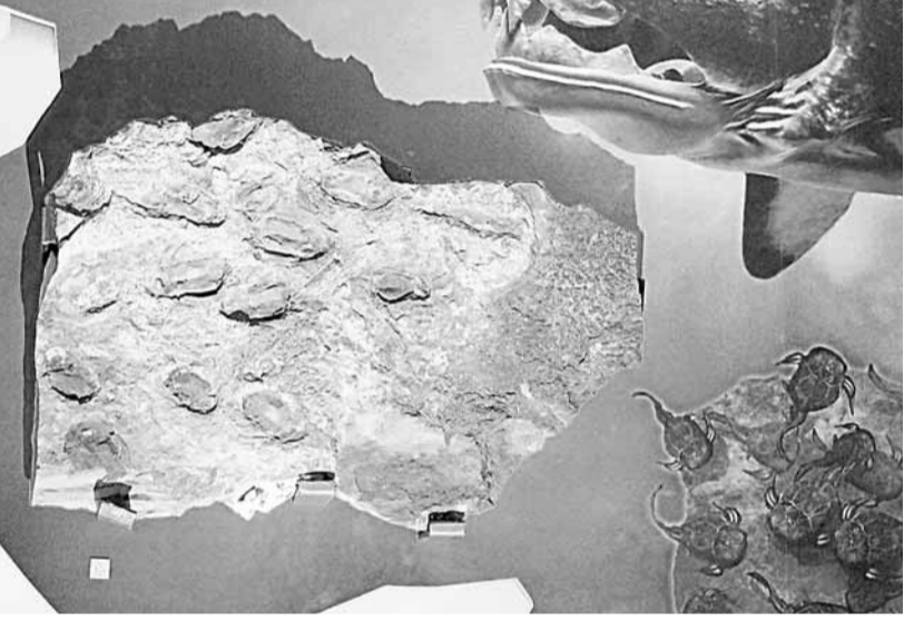
■ 「中國香港世界地質公園—史前故事館」展示數百件珍貴化石、古生物複製品及模型,包括從澳洲借來的溝鱗魚化石真品。