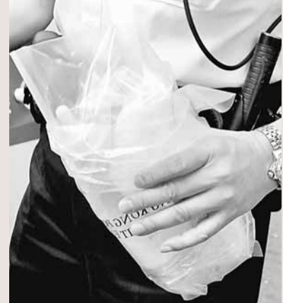
■ 警員檢走奶樽化驗。

香港文匯報訊(記者 杜法祖)粉嶺祥華邨一名初為人母少婦,昨晨在家為2個月大女兒餵奶,期間疑因女嬰睡著沒有將她弄醒掃風,後女嬰被父親發現在床上嘔奶昏迷,報警證實不治,警方經調查認為事件無可疑,女嬰確實死因有待剖屍檢驗。有兒科專家提醒家長,給初生嬰兒餵奶後記得掃風,以免嘔奶引致窒息。