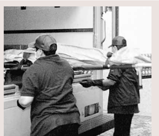
■ 猝死嬰兒遺體移送殮房。

他又表示,每人平均的消費額上升1成半,介乎6,000元至35,000元,反映消費意欲沒有受到金融市場波動的影響。