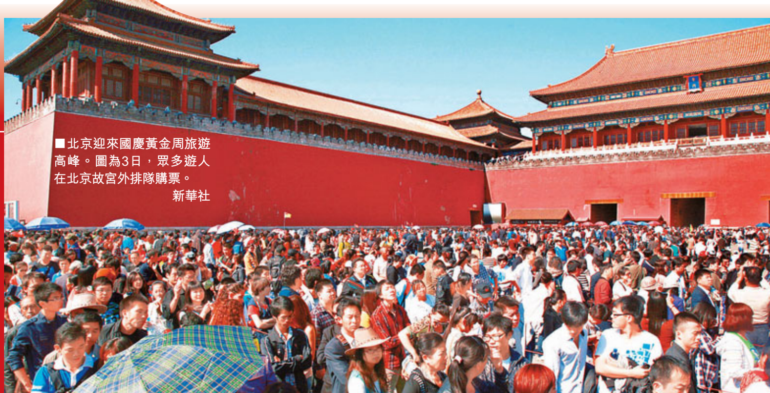
北京迎來國慶黃金周旅遊高峰。圖為3日，眾多遊人在北京故宮外排隊購票。

針對國慶節後民眾易患假期綜合症的問題，有醫生表示，假期出行、遊玩是一件很勞累的事情。10月7日是假期最後一天，民眾出遊回來後要盡量多休息，留出一定時間調整身體狀態，以便更好地投入到工作中。另外，飲食方面要清淡，讓疲憊的腸胃也歇歇，不要再暴飲暴食。