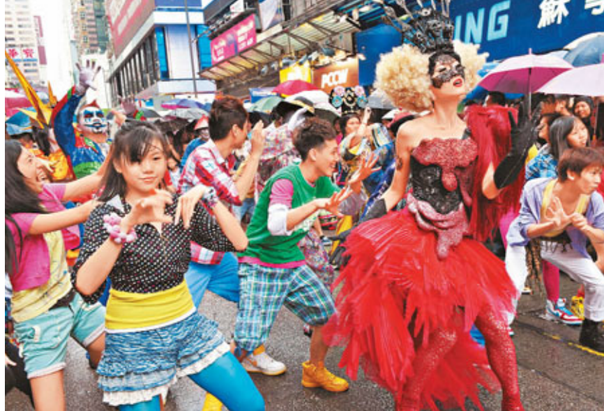
2日，香港海洋公園為萬聖節主題活動宣傳造勢，市民加入「群鬼」勁舞團一起勁歌熱舞。

香港文匯報訊(記者唐苗苗、通訊員鄧韻珊 廣州報道)3日國慶黃金周進入第三天，記者從廣州市各大旅行社了解到，國慶期間廣東出境遊線團隊已基本全部出發，僅剩東南亞及海島包機的部分團隊作最後一波出遊，而省內遊、港澳遊等短途遊一如預期，迎來了延後出現的出遊高峰，當天僅南湖國旅的省內遊及港澳遊的出遊人數就超過2.4萬人次。