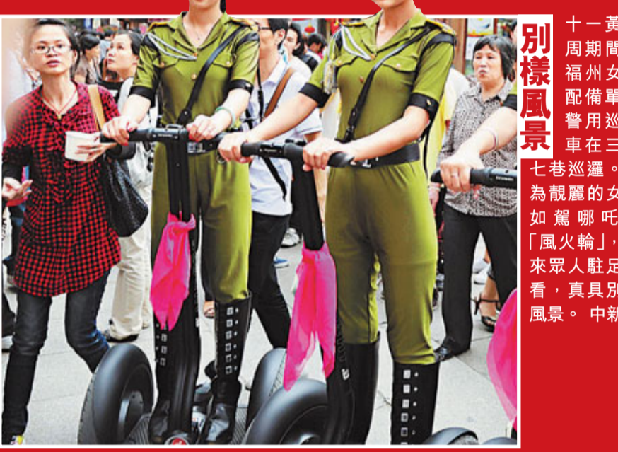
十一黃金周期間，福州女警配備單車巡邏三坊七巷巡邏。圖為靚麗的女警如駕哪吒的「風火輪」，引來眾人駐足觀看，真具別樣風景。