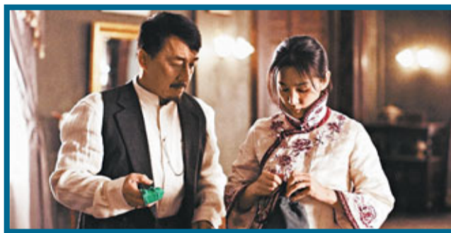
■成龍飾演的革命先烈黃興，以及李冰冰飾演的徐宗漢在戲中可謂吃盡苦頭。

《辛亥革命》有別於過往的主旋律電影，片中每個角色都很有血有肉。像成龍被炸斷手、李冰冰在海邊攪着黃花崗七十二烈士的遺體痛哭。而孫中山義正詞嚴地說服列國，氣勢磅礴的情節，至今仍歷歷在目。對於這震撼人心的一幕，趙文瑄把功勞歸於導演張黎。「每個導演也有不同的要求，和張黎導演是首次合作，他是一個很會說戲的人。導演也很敢於創新，他告訴我中山先生也是一個有血有肉的普通人，所以他要求我演的時間放鬆，回歸自然地演，不需擺出偉人的姿態。孫中山是一個無私的人，他不光推翻了清朝，也應當當初的承諾，把臨時大總統之位讓給了袁世凱。這樣的一個人物，將來如果有人再找我，我還會再演。」