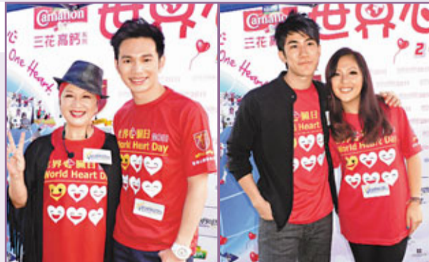
■家燕姐透露和現任男友「Q」君，2人拍拖已有幾年。

家燕姐愈講愈面紅。家燕姐透露現任男友是「Q」君，2人拍拖已有幾年，對方未曾曝過光，問到何時帶他出來，家燕姐笑謂：「適當時候先算，好多人結婚先曝光，不過我唔會結婚，最多是訂婚，訂婚可以永遠保持甜蜜，況且好少咁大年紀去結婚，至於何時結婚便要睇時勢，只要他在工作上關懷和支持我，久不久聚會便可以，他希望我每年接一部劇，但話給多些時間讓我愛我，呢句係咪好解，唔解。現時他在上海工作。」又，衛蘭和男友感情穩定，問她會否「閃婚」，她表示暫時唔會，亦沒有結婚計劃，之前