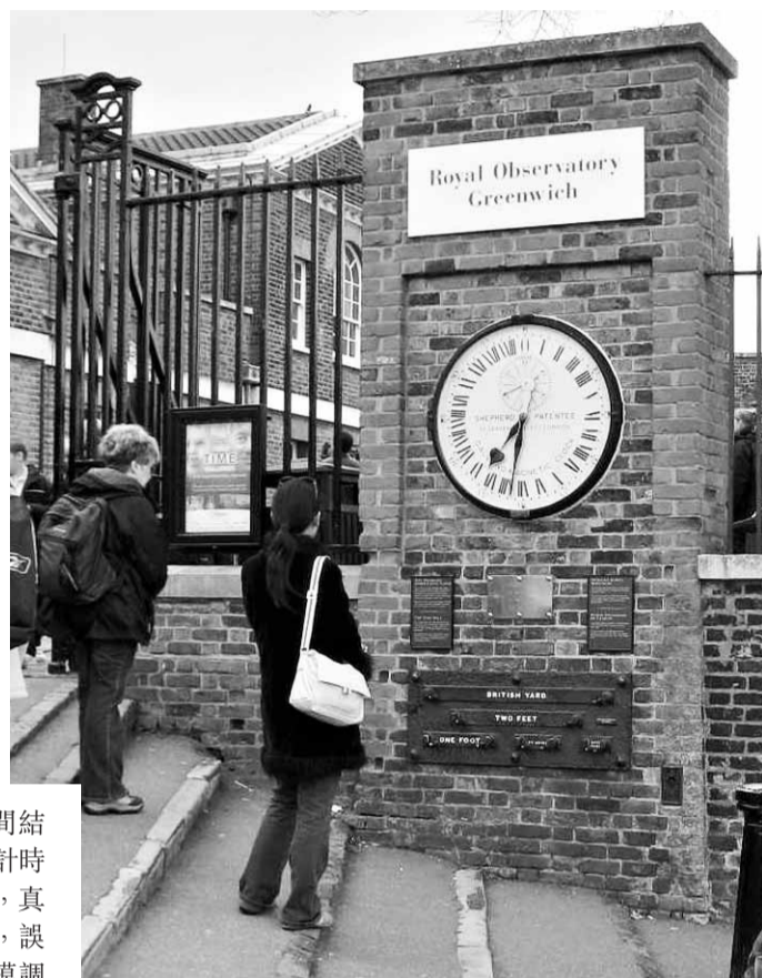
■GMT時間正走進歷史。圖為掛在格林威治天文台外的古鐘。