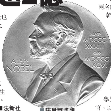
■法新社 ■諾貝爾獎牌

物理學獎、化學獎及醫學獎也是「超級大獎」，影響力冠絕全球所有科學獎。大學教職員中若出現諾貝爾獎得主，更能成為大學的「生招牌」，令大學揚名國際；個人成就更是無可比擬，說話更有份量，課堂變得座無虛席。然而，1992年經濟學獎得主貝克爾稱，得獎是權威象徵，令學生不敢質詢，扼殺課堂討論空間。