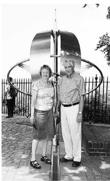
■格林威治的本初子午線，作為全球時區參考標準，一對夫婦各自站在兩邊拍照。

格林威治標準時間(GMT)一向是全球公認的計時標準，但時移勢易，GMT這個象徵當年維多利亞時代的大英帝國權威，也正走進歷史。國際電信聯盟(ITU)上周於日內瓦舉行的研討會上，討論由法國國際度量衡局(BIPM)推動、純以原子鐘作為新的計時標準的計劃，英國作為世界計時員的地位岌岌可危。