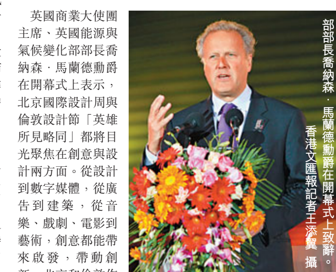
▲英國商業大使團主席、英國能源與氣候變化部部長馬蘭德勳爵在開幕式上致辭。

當晚的開幕式緊扣「設計」這一主題，不僅有10位著名設計師的現場即興創作，亦有運用3D投影和燈光呈現技術創作而成的新媒體立體投影表演。中華世紀壇在燈光的投射下時而講述著遠古的農耕故事，時而演變成現代的立體「魔方」。光影色彩奪目，音樂激情感澎湃，贏得了到場嘉賓的連連掌聲。 此外，出席開幕式的嘉賓還有英國駐華大使奧田、本屆北京國際設計周組委會執行主席、北京市常委、宣傳部部長、副市長魯煥、清華大學黨委書記胡和平。