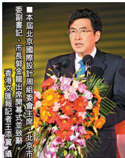
▲本屆北京國際設計周聯合會主席、北京市副市長馬君在開幕式上致辭。

9月26日晚，絢爛的燈光、激情的音樂將北京中華世紀壇「裝扮」得時尚又不失民族風情。在秋日煦和的微風中，在月色撩人的光影下，北京國際設計周暨首屆北京國際設計三年展正式拉開帷幕，共同開啟為期一周的北京設計之旅。