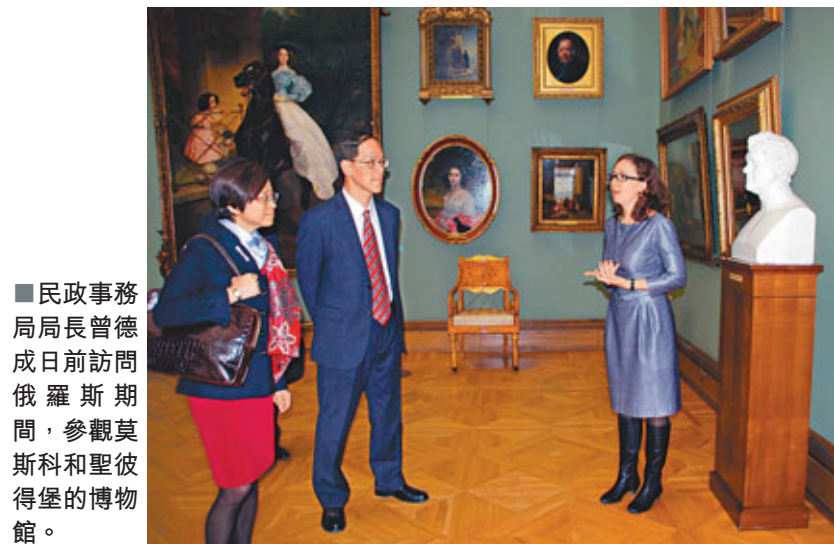
■民政事務局局長曾德成日前訪問俄羅斯期間，參觀莫斯科和聖彼得堡的博物館。

曾德成坦言，「人大釋法」是香港體制一部分，事實是釋法為香港帶來了正面效應。特區政府與俄羅斯簽署諒解備忘錄，將為兩地文化藝術的緊密合作揭開新里程。香港博物館將會與俄羅斯著名的博物館合作，探討把俄羅斯的珍寶館藏拿到香港展出。香港市民也會有更多機會欣賞到俄羅斯世界級的藝術表演。香港藝術家與藝術品，當然也有機會到俄羅斯演出和展出。