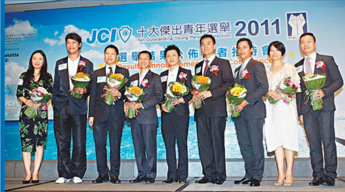
■新一屆「傑青」昨日「出爐」，今年有9位得獎者分別來自工商界、音樂界及藝術文化界等。