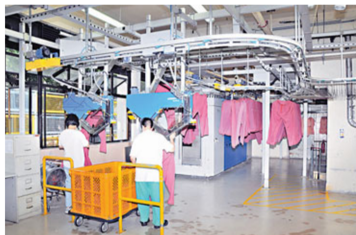
柴灣洗衣房轉用隧道式整熨方法,整熨於封閉空間進行,減低釋出熱量。

香港文匯報訊(記者 曾偉龍)港島東醫院聯網管理的柴灣洗衣房因設置整熨、乾衣機器,釋出大量熱能,導致室內溫度較戶外高2℃至3℃;夏天最高溫度可達35℃。有見及此,醫管局斥資4,000萬元,改善環境及提高洗衣房效率,以封閉隧道式整熨取代蒸氣夾熨,並加裝通風管和天窗,使洗衣房內約80%區域的溫度與室外相若,減低洗衣房工人中暑風險。