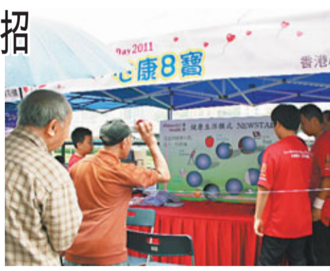
香港心臟專科學院昨日舉行心臟健康嘉年華。

他表示,心臟病包括冠心病、心臟猝死、先天性心臟病等,當中以冠心病為主要致死因素。該院前院長蔣志想醫生表示,心臟病