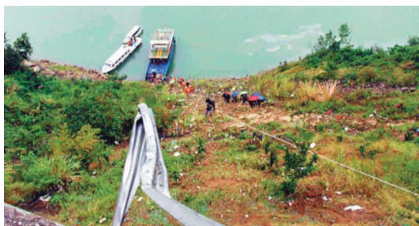
一輛載有35名乘客的雙層臥舖客車途經湖北興山境內時墜崖,其中一名傷者是香港人。

香港文匯報訊(記者 俞鯤、林曉晴)一輛載有35名乘客的雙層臥舖客車前日傍晚在途經312省道湖北興山境內時墜崖,釀成16死19傷1失蹤慘劇,多人傷勢嚴重。其中一名傷者是香港人。醫院指他手部受傷,還有一名澳門人死亡。