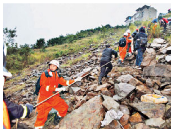
一輛大型客車在湖北興山墜崖落水,至少造成16人死亡,消防官兵利用繩索在事故現場救援。