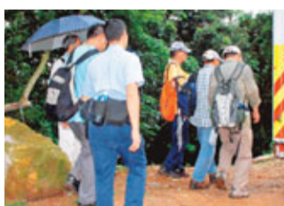
城門水塘被蜂螫傷行山人士送院救治。

香港文匯報訊(記者 杜法祖)城門水塘昨日發生行山人士遭野蜂襲擊受傷意外。10名退休公務員,昨相約往荊灣大帽山行山,途至城門水塘波蘿壩時,因要跨過被颶風吹塌擋路的大樹,期間有人疑誤觸樹上蜂巢,致被蜂群追襲,其中4人被蜂螫傷須送院治理。