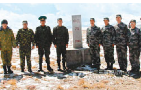
■中塔新劃定國界交接儀式後合影。

根據中塔2010年4月27日簽訂的《中華人民共和國和塔吉克共和國政府關於中塔國界線的勘界劃定書》，塔方實際控制下的1158平方公里土地劃歸中方。納扎波夫中校說，兩國邊界線的清晰、明確，有利於兩國邊境地區和平穩定，更進一步推動兩國睦鄰友好關係的發展。