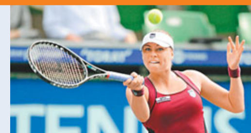
施禾娜莉娃將與拉雲絲卡爭冠。

而昨日舉行的泛太平洋公開賽準決賽，施禾娜莉娃在首盤賽事中曾以大比數1:5落後，但仍然臨危不亂，最終以7:6反勝取下首盤。第2盤比賽開始，施禾娜莉娃便如有神助愈打愈順，