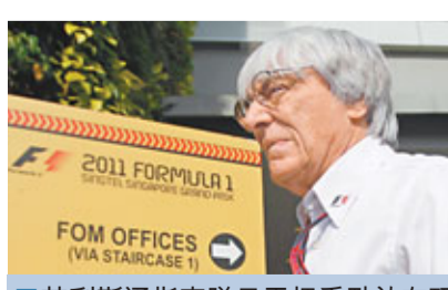
艾利斯通指車隊只需把重點放在研發具競爭力的戰車便可。

另外，正在康復的波蘭F1車手古比卡日前答應雷諾領隊保利尼，最快11月答覆明年能否重返F1賽場。古比卡在今年2月於一場拉力賽中發生車禍，身體遭受重創，右手幾乎斷掉，不過