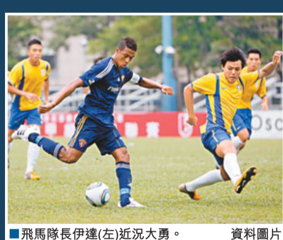
飛馬隊長伊達(左)近況大勇。資料圖片

香港文匯報訊(記者 郭正謙)高級組銀牌賽最強之戰提前上演！天水圍飛馬及傑志今季兩支表現最為對壘的勁旅，今日下午5時45分將會師元朗大球場為高級組銀牌賽拉開帷幕，3戰全勝的飛馬將會硬撼狀態漸起的傑志，為25萬元冠軍獎金和2013年亞協盃入場券決一生死。門票分收60元、長者及學生特惠票20元兩種。