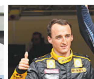
古比卡爭取重返F1賽場。資料圖片

經過5次手術後，古比卡康復進度良好，其主診醫生日前更坦言這名波蘭車手明年肯定可重返F1賽場，最遲1月便可宣告回歸。