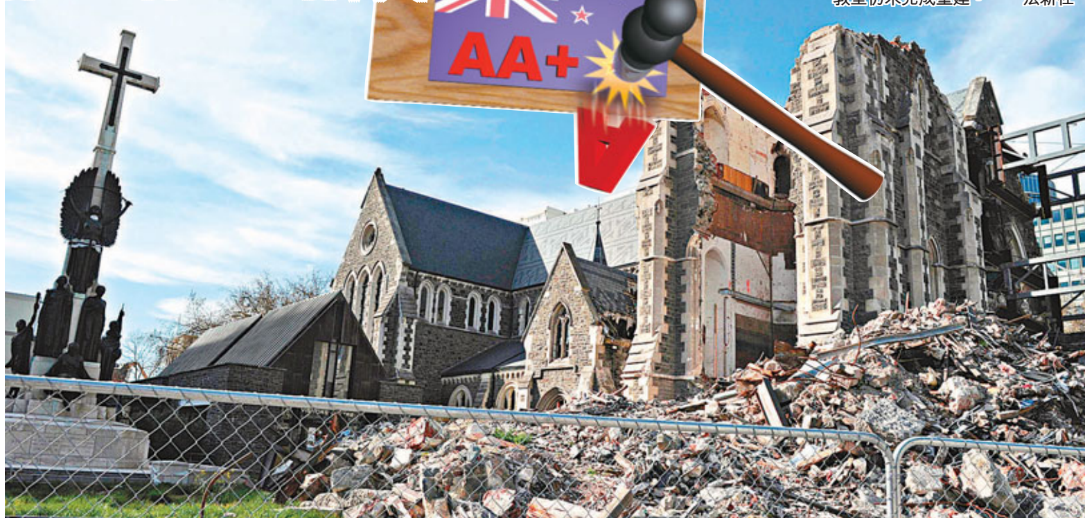
■新西蘭基督城地震重建開支龐大，令外債數額劇增。圖中所見教堂仍未完成重建。