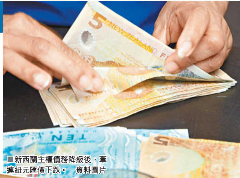
■新西蘭主權債務降級後，牽連紐元匯價下跌。資料圖片