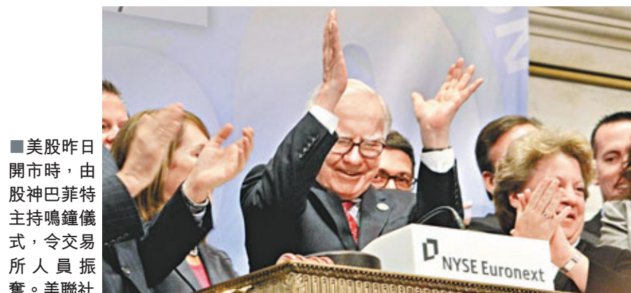
■美股昨日開市時，由股神巴菲特主持鳴鐘儀式，令交易所人員興奮。

美國8月份個人收入近兩年來首次下跌，加上歐洲通脹升幅超出預測，拖累美股昨日低開逾百點，但後來公布的消費者信心數據造好，令跌幅減少。道瓊斯工業平均指數早段報11,106點，跌47點；標準普爾500指數報1,151點，跌8點；納斯達克指數報2,460點，跌20點。