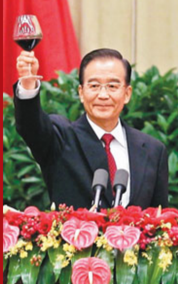
■國務院總理溫家寶提議舉杯祝酒。

溫家寶重申，中國要繼續高舉和平、發展、合作的旗幟，與世界各國人民一道，共同分享發展的機遇，共同應對各種挑戰，建設一個持久和平、共同繁榮的和諧世界。他說，中國生機勃勃、欣欣向榮，中國的未來前程似錦、充滿希望。