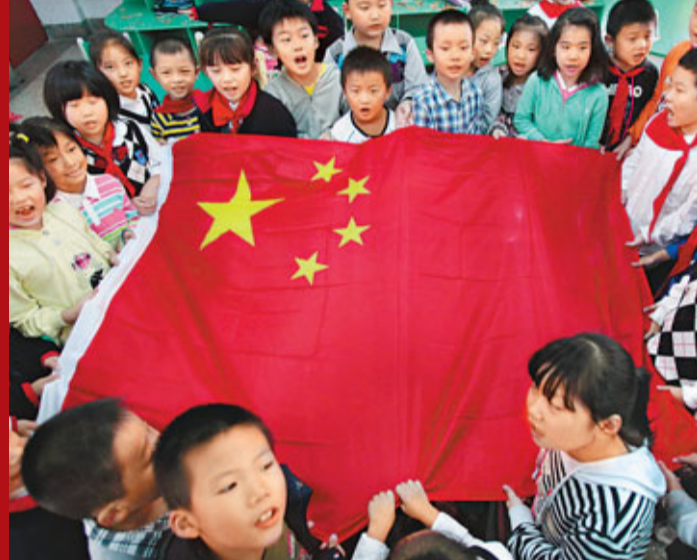
■9月30日，南京火瓦巷小學二年級的學生們手挽國旗，高唱國歌，迎接中華人民共和國62歲華誕。