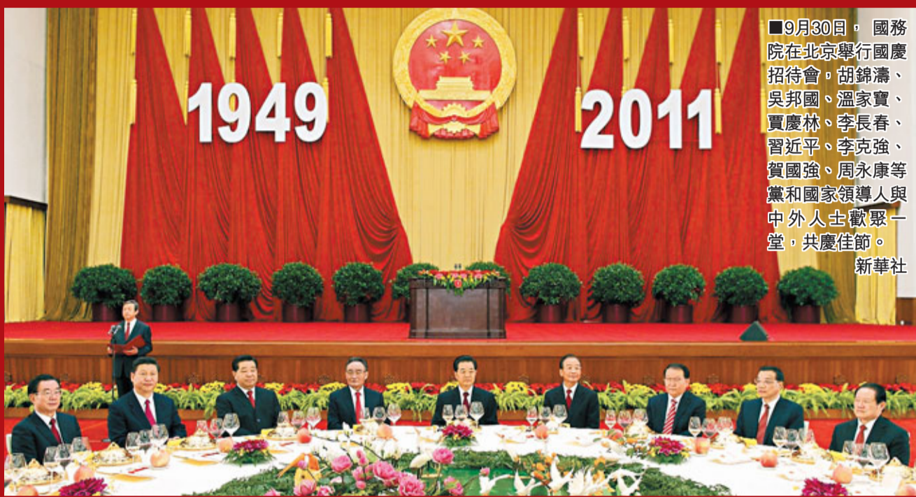
■9月30日，國務院在北京舉行國慶招待會。胡錦濤、吳邦國、溫家寶、賈慶林、李長春、習近平、李克強、賀國強、周永康等黨和國家領導人與中外人士歡聚一堂，共慶佳節。新華社

香港文匯報訊(記者 葛沖 北京報導) 國務院昨晚在人民大會堂舉行盛大招待會，慶祝中華人民共和國成立62周年，胡錦濤、吳邦國、溫家寶、賈慶林、李長春、習近平、李克強、賀國強、周永康等黨和國家領導人與1,000多名中外人士歡聚一堂，共慶佳節。國務院總理溫家寶在招待會致辭時表示，要保持物價總水平基本穩定，落實房地產市場調控政策和保障性住房建設計劃，讓人民群眾生活得幸福、安全，更有尊嚴。