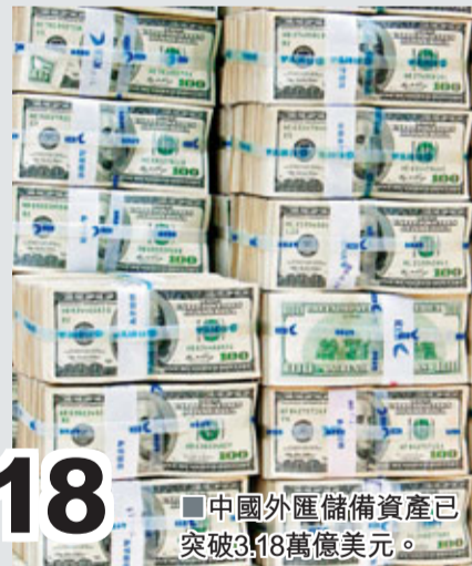
■中國外匯儲備資產已突破3.18萬億美元。

據中新社北京30日電 中國國家外匯管理局30日公佈的最新數據顯示，二季度中國國際儲備資產再度增加1,425億美元。今年上半年，中國國際儲備資產已累計增加2,837億美元。其中廣受關注的「外匯儲備資產」一項，在二季度增加了1,430億美元。迄今，中國外匯儲備資產已突破3.18萬億美元。