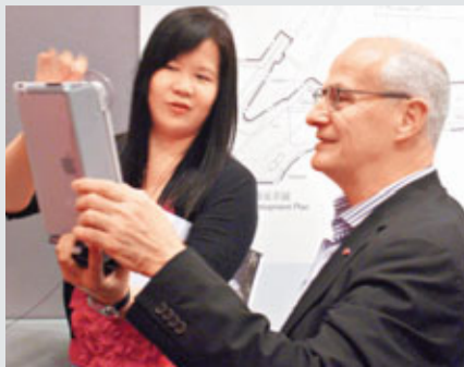
連納智玩西九文化區諮詢apps。

香港文匯報訊(記者 歐陽麗珠) 西九文化區第3階段公眾諮詢昨日展開。西九管理局行政總裁連納智昨日視察諮詢會場館後表示,由於建材價格上漲,早年向港府申請的216億元撥款未必足夠,管理局正積極研究融資方案,包括尋求贊助、捐款及以命名方式籌款,不排除發債集資,但他拒絕透露尚欠資金數額。