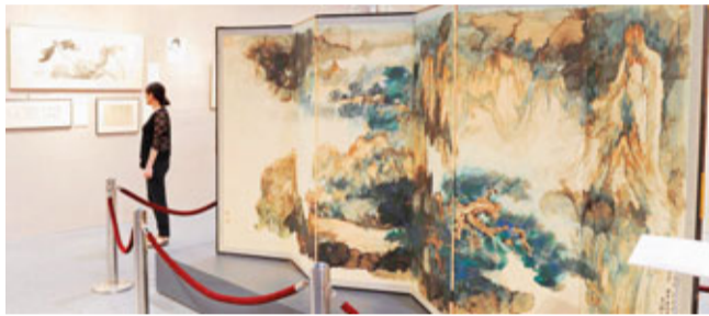
張大千送予女兒作結婚禮的巨型屏風。中新社

香港文匯報訊(記者 歐陽麗珠) 香港蘇富比今天起一連6天舉行秋季拍賣及珍品展覽,拍賣3400件珍品,總估價超過27億港元。其中最受矚目是一枚極罕有的9.27卡拉鮮彩粉紅鑽石指環,估價1.5億港元。此外,還展出近30幅首度公開亮相的張大千作品。同場,蘇富比預展11月紐約拍賣會焦點作品:畢加索的《黎明小夜曲》和克林姆的《阿特湖畔的利茨爾貝格》。