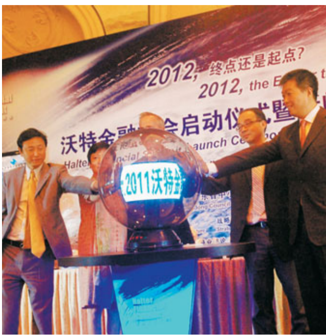
沃特金融峰會移師廣州舉行。

據了解,沃特金融峰會是聚首全球金融界人士的高端年度盛會,由沃特財務集團發起並主辦。2010年4月,首屆沃特金融峰會在上海舉行,出席嘉賓包括美國前總統布希、美國前財長約翰·斯諾、上海市委書記俞正聲等。