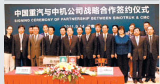
中國重汽與中機公司簽署戰略合作協議。

香港文匯報訊(記者 何冉 濟南報道)中國重汽集團與中國機械進出口(集團)有限公司日前在濟南簽署合作協議,雙方將在國際工程承包等多方面開展進一步合作。簽約儀式上,中國重汽旗下進出口公司和特種車公司亦分別與中機運輸機械事業部簽署《海外運輸合作協議》和《特種車輛項目合作協議》。