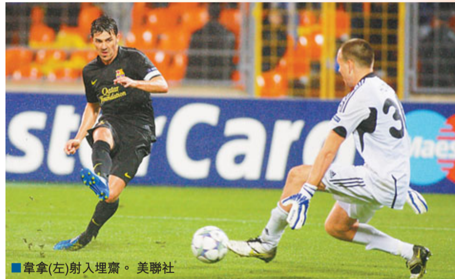
拿拿(左)射入埋齋。