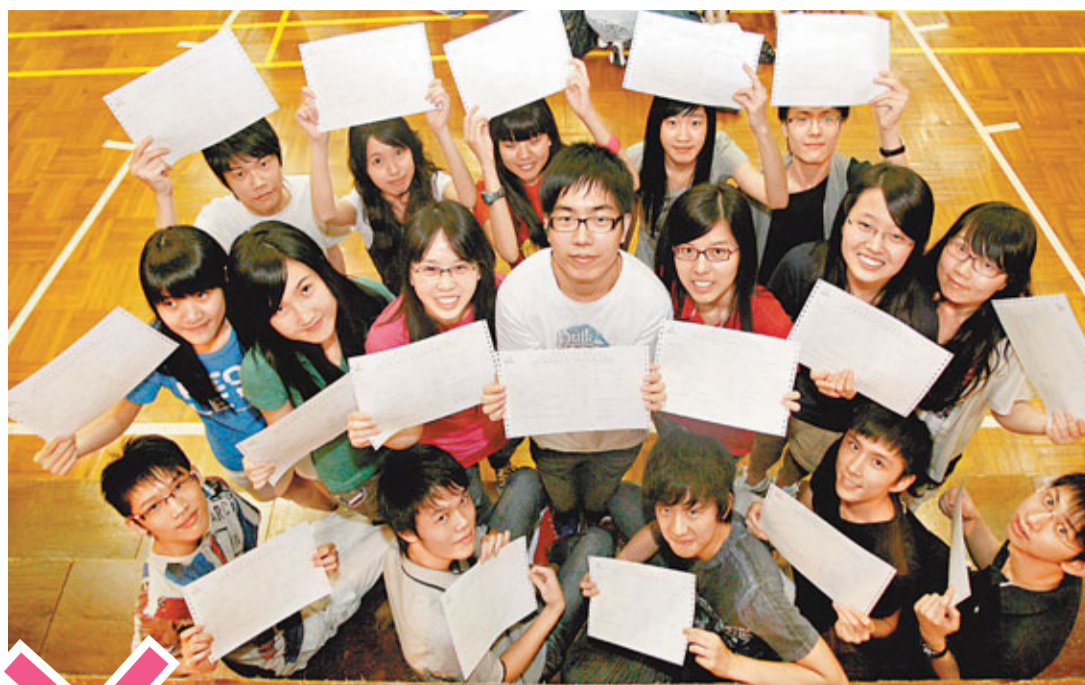
■考評局數據顯示，2006至2011年，每年考獲大學最低收生要求的女生比同屆男生多出1,400至1,700人。圖為高考放榜男女狀元合照。

根據統計處最新出版的《香港的女性及男性——主要統計數字2011》，當中引述教資會數字顯示，2010/11學年，成功入讀8大院校資助課程的女生超越4萬大關，較只得不足3.5萬的男生多出約16%，相差逾5,500人。而有關差距亦非最近出現，過去5個學年，8大院校女生比男生已持續多出5,000至6,000人(表一)。