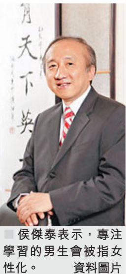
侯傑泰表示，專注學習的男生會被指女性化。 資料圖片

他表示，要減少這情況出現，應放下性別定型的思維，如不應再強調「女性一定要斯文，男生就要好動、玩機關槍」，讓男女學生都能夠自然發展其性向及才能。