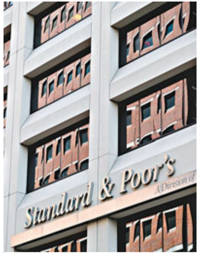
標普指日本政局多變動，難推出長期政策。小圖為首相野田佳彥。資料圖片