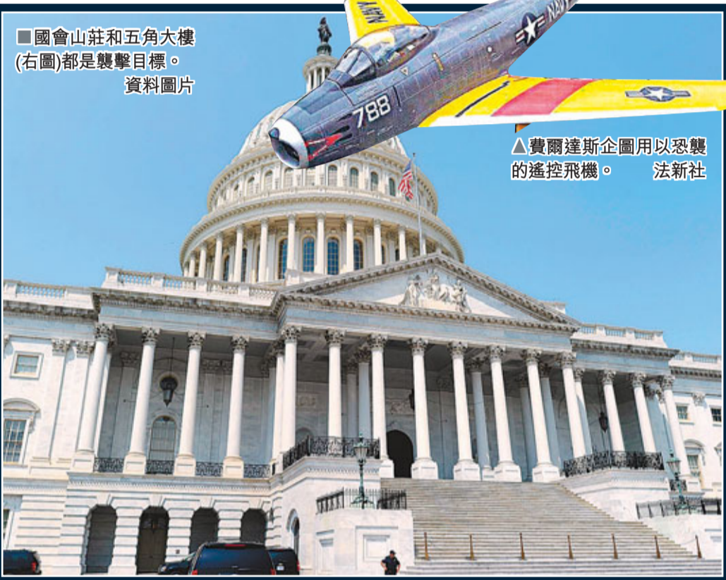
國會山莊和五角大樓(右圖)都是襲擊目標。資料圖片