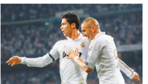
C朗(左)和賓施馬齊有進帳。

皇馬在25分鐘打出一氣呵成的精彩組織，沙治奧拉莫斯後場傳球給奧爾爾，後者斜傳C·朗拿度(C朗)，C朗與卡卡交叉走位撞牆後傳給中路插入的奧斯爾，奧斯爾再分給右路的賓施馬，法國前鋒即時傳給中路的C朗，後者在12碼點附近射門得手。41分鐘，卡卡接到C朗的傳