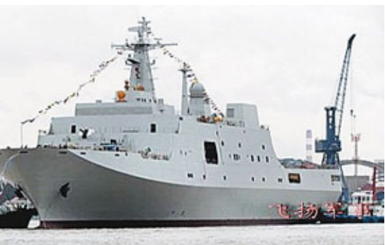
■中國海軍第三艘071級綜合船塢登陸艦。

崔永林說，實現半島無核化、維護半島和平穩定是朝方的一貫立場，朝方主張無條件重啟六方會談。