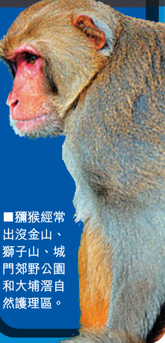
獼猴經常出沒金山、獅子山、城門郊野公園和大埔滘自然護理區。

在林間小徑中悄悄前行，遊人或會看見許多雀鳥和野生生物，要是想在又高又濃密的樹頂上搜尋鳥蹤，則需借助雙筒望遠鏡。大埔滘常見的鳥類最少有十二種，包括珠頸斑鳩、喜鵲、白頭鸚鵡和紅耳鸚，每逢冬天還可見到季鳥令鳥，夏天則是大量杜鵑和黑卷尾出沒的日子。黃鸝的聲音或會傳來耳際，豹貓、穿山甲和豪豬的影蹤偶爾會在眼前晃過。每屆冬末春初，總有漂亮的蝴蝶翩飛躍舞，其他的如蜻蜓、淡水魚、兩棲類動物、爬蟲類動物和哺乳類動物的品種也很多，為如畫的景致添上美意。