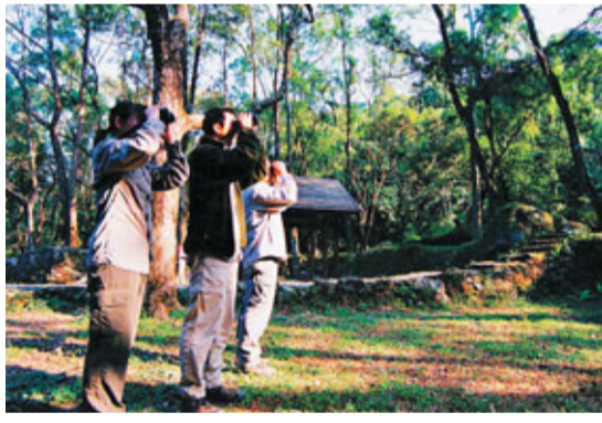
人們可在大埔滘自然護理區內觀鳥，猶如置身於世外竹林中。

大埔滘林徑最長路段約十公里，分為四段路，行山人士可隨自己的體力而選擇。四條路段均是環繞一周而行，起點與終點相同，甚至途中會接回同一段路。全程大部分路段都是林蔭小路，甚至兩排竹樹，竹樹幹幼細，一枝枝排列，整齊得很，走起來非常舒服，猶如置身於世外竹林中。其中一段可遙望馬鞍山，如兩隻馬鞍形成的一座山清晰可見，站在山路上，還可鳥瞰中大和科學園。