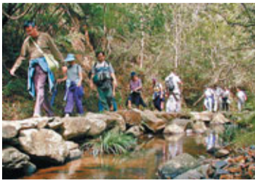
大部分路段都是林蔭小路，走起來非常舒服。