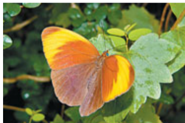
環蝶是相對較遲出沒的，直至清明才在城門水塘和大埔滘有串珠環蝶被發現。

大埔滘的自然資源是經過多年努力的成果，這裡的植林工作始於二十年代，包含了草山東坡向下延至大埔道的林區。建立經年的植林區，樹木品種逾百種，其中混雜了歷史悠久的植林和天然長成的新生樹木，主要的種植品種為馬尾松，而這也是該地帶俗稱「松仔園」的由來。這裡還種植了紅膠木、白千層、杉樹和台灣相思樹等外來樹木，形成了今天肥沃的土地，讓原生樹木能繁衍生長。近年開始小規模地種植樟、杉、台灣相思和白千層等品種，而這裡亦有潺槁樹、楡藤子和楓香等有趣的本地品種。