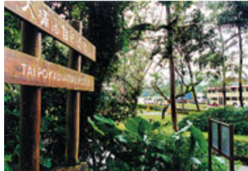
大埔滘林徑位於大埔滘自然護理區內