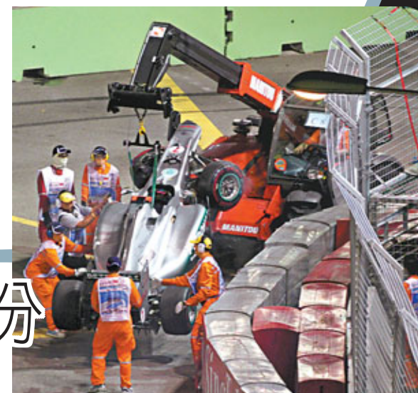
舒麥加的戰車撞毀後被吊起。

咸美頓在賽場上過勇的表現一直為人詬病，但這名08年世界冠軍認為自己沒有問題，無意改變駕駛作風，並聲言自己愛冒險，適合昔日的比賽環境，暗示不像現今的車手般「錫身」。對於咸美頓再受到其他車手炮轟，麥拿命車隊領隊韋特馬殊開腔為其辯護，認為這純粹是賽車意外。