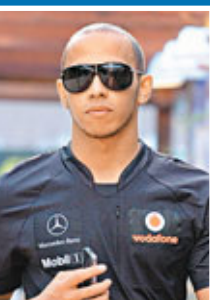
咸美頓成為眾矢之的。

眼看愛兒今年獨自應付從四方八面衝來的各方批評聲音，咸美頓父親兼昔日經理人安東尼周一便建議其子改變管理模式，另覓「貼身經理人」協助解決問題。