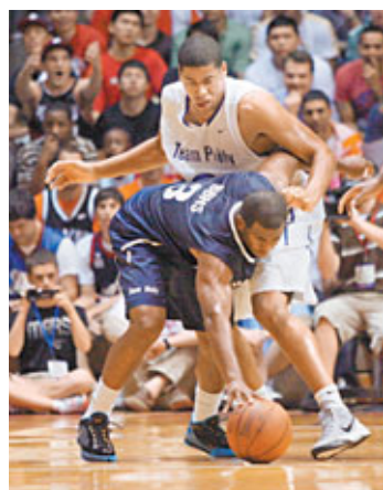
基斯保羅(左)有份參與費城慈善賽。

據新華社25日體育專電，儘管勞資雙方談判陷入僵局，聯盟無限期推遲新球季訓練營和取消43場季前賽，紐約人球星安東尼25日表示，他和其他球員團結一致，鼎力支持球員工會。