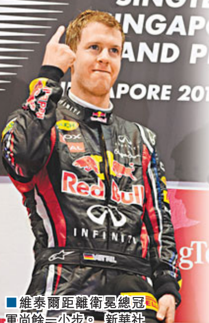
維泰爾距離衛冕總冠軍尚餘一小步。