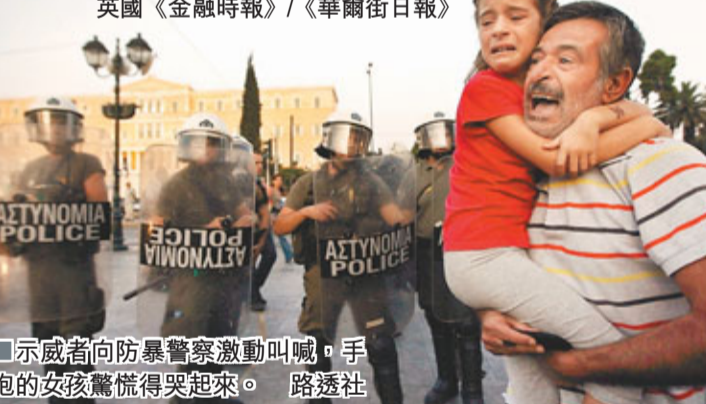
示威者向防暴警察激動叫喊，手抱的女孩驚慌得哭起來。