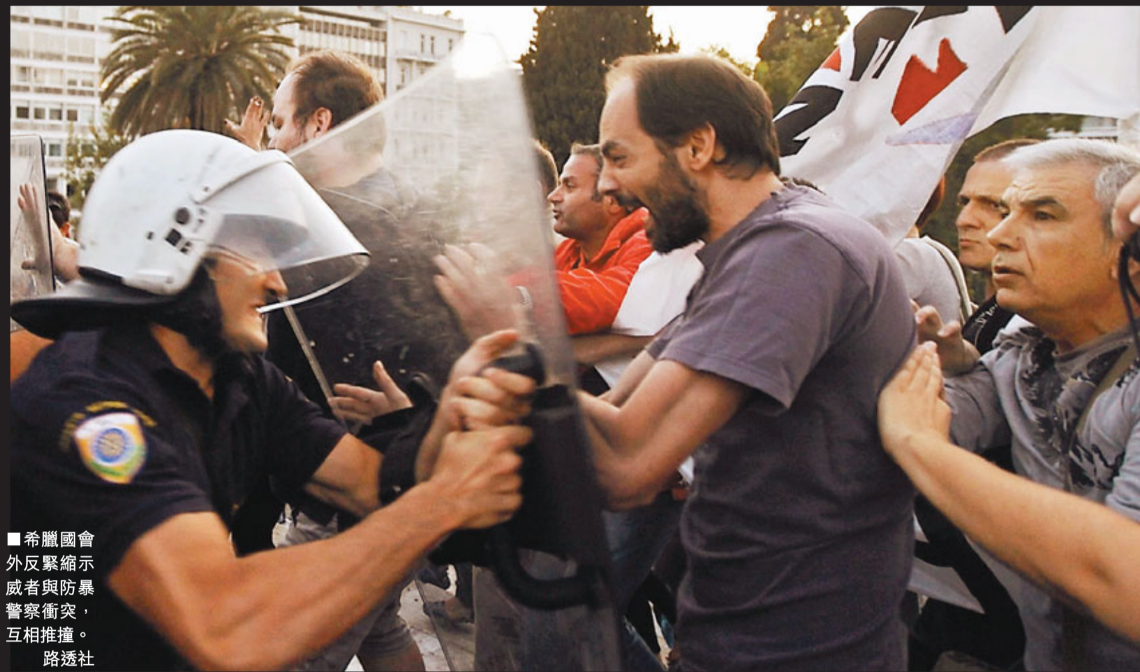
希臘國會外反緊縮示威者與防暴警察衝突，互相推撞。