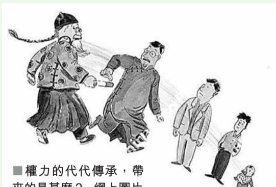
權力的代代傳承,帶來的是甚麼? 網上圖片