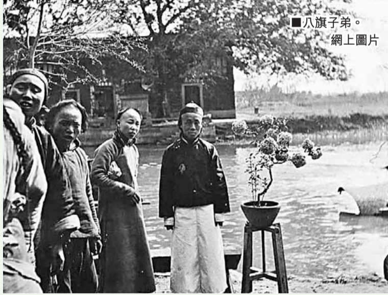
八旗子弟。網上圖片