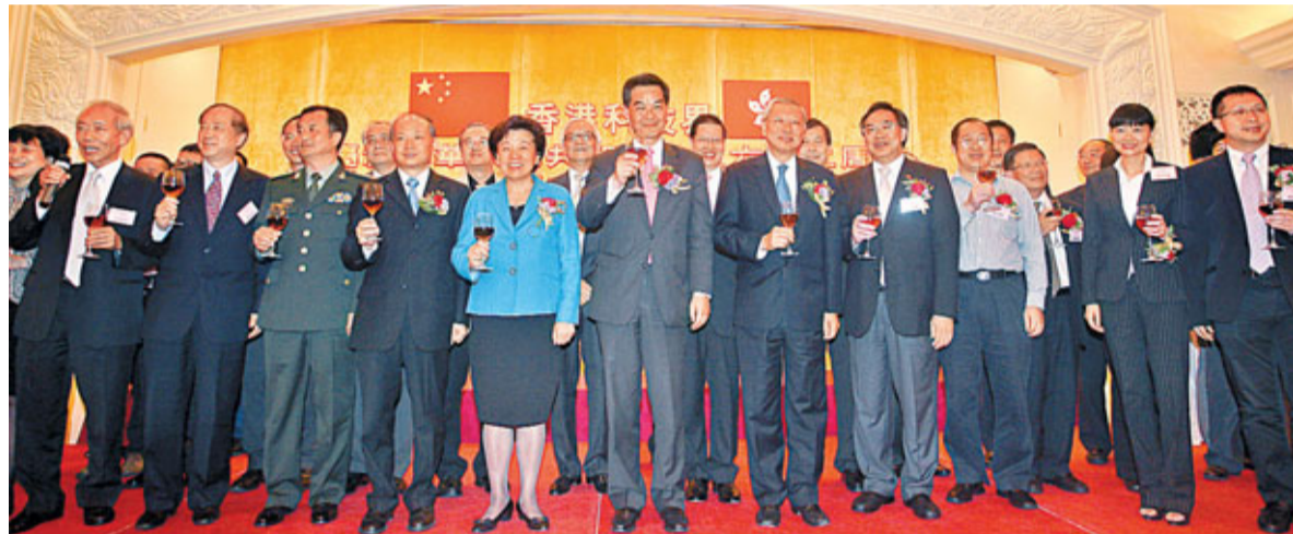
香港科技界慶祝國慶，賓主舉杯祝酒。

香港文匯報訊(記者 沈清麗) 香港科技界慶祝國慶籌委會日前假中環美心皇宮舉行慶祝中華人民共和國成立62周年聚餐晚會。中聯辦副主任殷曉靜，行政會議召集人、籌委會主席團主席梁振英，外交部駐港副特派員詹永新，解放軍駐港部隊副司令員董朝，籌委會執行主席盧偉國出席主禮。近500名粵港科技界人士和嘉賓聚首一堂，共賀國慶，氣氛熱烈。