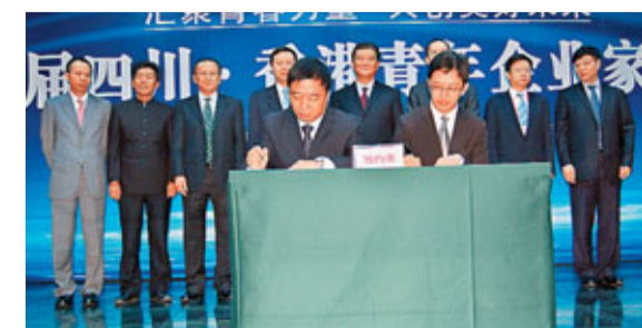
香港青聯與共青團四川省委簽訂意向性合作協議。

與會的香港青年企業家還為映秀小學的「香港青年聯會留守學生之家」揭牌，並向其捐款100萬元人民