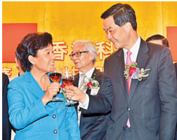
梁振英(右)與殷曉靜相互祝酒。

盧偉國致辭則表示，香港科技界一直致力促進香港的科技發展，推動香港和內地科技領域的合作，為建設