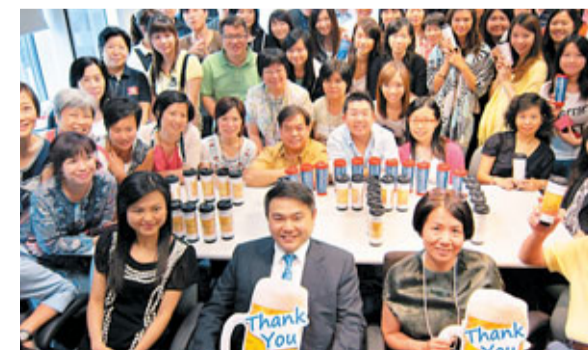
花旗集團高層在員工感謝日與職員合照。

香港文匯報訊 花旗集團一直以來能為顧客提供卓越的服務，實在有賴所有員工辛勤的工作及敬業的精神。集團今年繼續舉行「員工感謝日」，並特別訂造了一批精美的咖啡杯，由管理層親自送贈同事以表謝意。集團今年更透過電腦發幕，一連5個工作天以不同語言感謝員工。