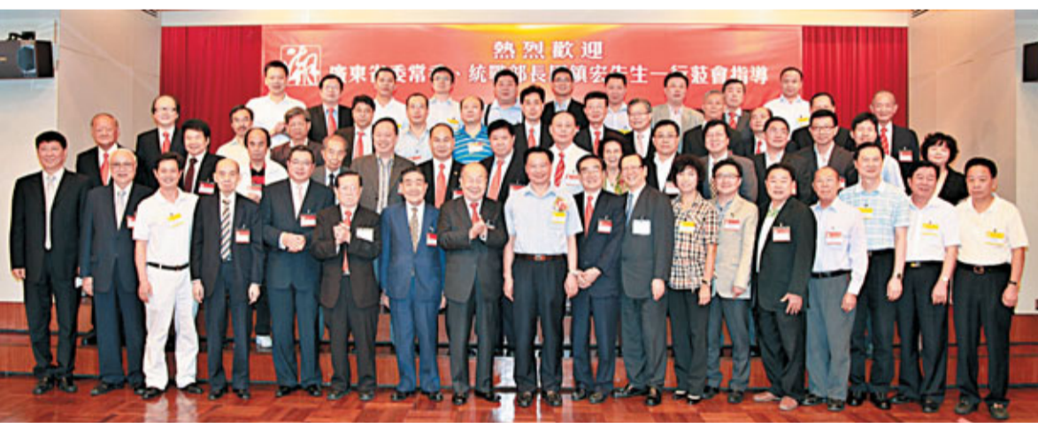
香港潮屬(粵東)社團首長與廣東省委常委、統戰部部長周鎮宏等嘉賓合照。

周鎮宏說，粵港兩地的前景都很好，他對香港潮人團結一心、共同奮鬥，遵守法紀、支持特區政府依法施政的精神印象深刻。他特別指出，在國家「十二五」規劃中，粵港合作佔了相當重要部分，希望香港潮屬企業家要抓住機遇，積極部署參與，廣東省會為香港