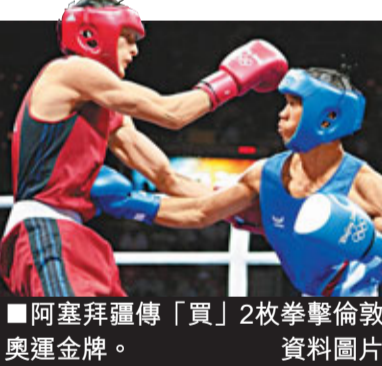
■阿塞拜疆傳「買」2枚拳擊倫敦奧運金牌。資料圖片

BBC在報道中並未提及消息來源，只透露世界拳擊系列賽首席執行官霍達巴卡什參與這宗不正當交易。報道稱，由於美國經濟不景，世界拳擊系列賽在美賽事的資金方面有嚴重缺口，為此接受阿塞拜疆方面的賄賂。不過霍達巴卡什回應時表示，這完全是「一場騙局」。