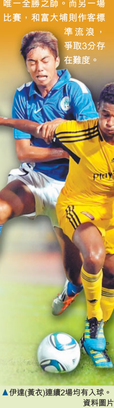
▲伊達(黃衣)連續2場均有入球。

標準流浪 對 和富大埔 地點： 青衣運動場 時間： 下午5時30分 門票： 60元、20元(長者及學生特惠票)