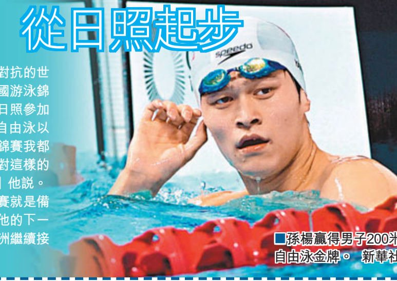
孫楊贏得男子200米自由泳金牌。新華社

新華社山東日照21日電 「世錦賽」一直沒有進行系統訓練，這次來日照參加比賽是我恢復訓練的第一步」。世界冠軍孫楊21日在日照進行的全國游泳錦標賽200米自由泳中，以1分45秒53的成績勇奪桂冠後表示，雖然恢復訓練較晚，比賽成績還是讓他滿意的。孫楊，這位90後的大男孩，在經歷了世錦賽奪冠的喜悅以及一系列事件後，在記者面前顯得頗為成熟。他表示，相比高水準對抗的世錦賽，他完全能夠頂住全國游泳錦標賽的競爭壓力，他將在日照參加200米、400米和1500米自由泳以及接力項目的角逐。「世錦賽我堅持下來了，我的體力應對這樣的國內比賽沒有任何問題，」他說。孫楊透露，此次全國錦標賽就是備戰倫敦奧運會的第一步，他的下一步訓練計劃是12月前往澳洲繼續接受名帥丹尼斯的指點。