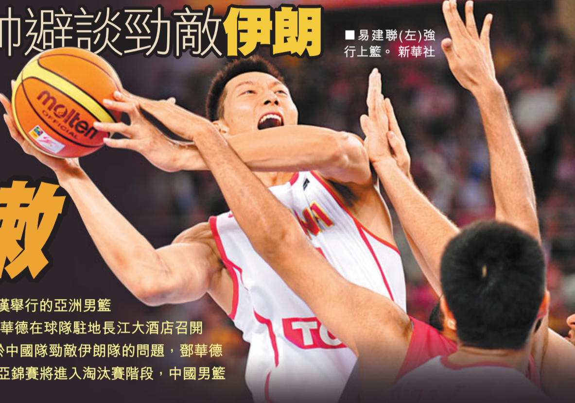
易建聯(左)強行上籃。

香港文匯報訊（記者 梁啟剛）武漢舉行的亞洲男籃錦標賽22日休賽1天，中國隊主帥鄧華德在球隊駐地長江大酒店召開了新聞發佈會，對於媒體關心的關於中國隊勁敵伊朗隊的問題，鄧華德依然避而不答。至於在23日晚8時，亞錦賽將進入淘汰賽階段，中國男籃將在8強戰迎戰實力不差的黎巴嫩。