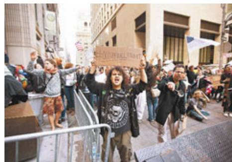
紐約「佔領華爾街」示威活動。資料圖片

互聯網巨擘雅虎被指在上周末紐約舉行的「佔領華爾街」示威活動中，封鎖了不少包含此內容的電郵。雅虎周一正式道歉，並稱封鎖行為是無意之舉。