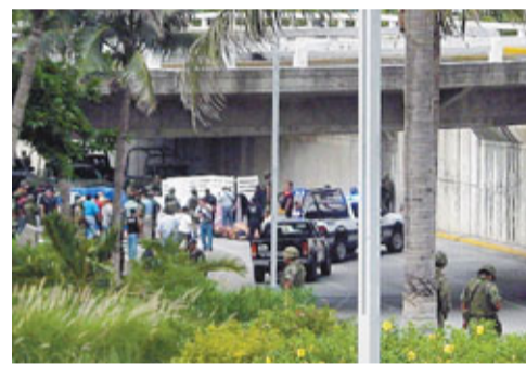
警員在棄屍現場調查。

警方正調查事件。該州總檢察長埃斯科瓦爾稱，前日下午有人在博卡—德爾里奧市內「美洲商場」附近的道路中央，發現兩輛廢棄卡車。據目擊者稱，約下午5時，4輛卡車開到事發地點，隨後車上走下幾名持槍者封鎖道路，他們拉開其中兩輛卡車的車門，並將車內幾具屍體拖到地面上。後來警方趕到現場調查，共發現35具屍體，其中23具為男性，12具為女性，目前檢方已確定7名死者的身份，均為墨西哥境內涉毒品犯罪集團懷疑死者屬於同一個犯罪組織的成員，「塞塔」成員。