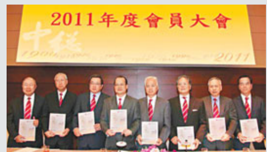
中總首長出席周年會員大會。

參與演出的團體包括：工俱舞蹈團、香港青年博藝坊、工聯會業餘進修中心、搖擺扭腰舞同樂會、製衣服飾從業員協會、紡織染工會采延舞集及香港建造業總會建藝舞蹈社。