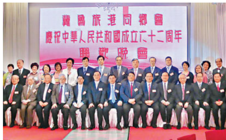
冀魯旅港同鄉會慶祝國慶實主合照。

香港文匯報訊 冀魯旅港同鄉會日前舉行慶祝中華人民共和國成立62周年晚宴。中聯辦調部副部長王子平、經濟部副部長孫文秀、行財部副部長周雲平，外交部駐港特派員公署辦公室主任馬占嶺、主任孫紅革等應邀出席。