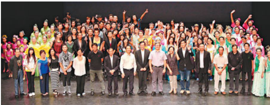
「舞動2011」活動上嘉賓與參加者合照。

英，融合中西文化，馳騁於舞蹈天地，活現舞動奇蹟」作為主題，舞蹈種類更多元化，期望藉此促進表演團體的互动交流，提升藝術水平，舞者年齡由5歲至70多歲。