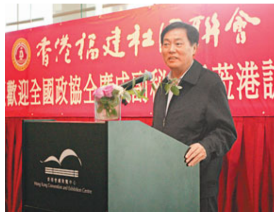
全廣成感謝大家對內地經濟、社會發展的貢獻。

全廣成形容在港時間短暫，能與福建社團聯合會共進午餐來結束此行，倍感榮幸。他感謝大家多年對內地經濟、社會發展做出的貢獻，對全國政協及北京市的大力支持和關心，並強調全國政協一定繼續為大家服務，頓時贏得席間一片掌聲。