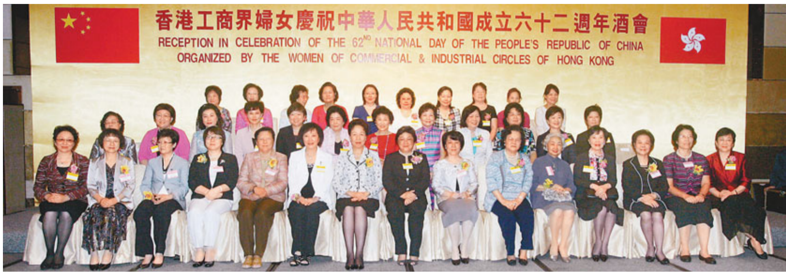
香港工商界婦女舉行慶祝國慶酒會，實主合照。 香港文匯報記者 劉國權攝

香港文匯報訊(記者 沈清麗) 香港工商界婦女日前假港島海逸君綽酒店隆重舉行慶祝中華人民共和國成立62周年酒會。中聯辦副主任郭莉，外交部駐港特派員公署參贊、特派員呂新華夫人呂張靜姪，全國人大常委范徐麗泰，香港基本法委員會副主任梁愛詩，全國婦聯組織聯絡部部長張黎明，上海市婦聯主席張麗麗，廣東省婦聯常務副主席周麗瓊，特區環境局副局長潘潔，原中聯辦副主任陳鳳英，香港工商界婦女國慶籌委會主任委員黃周娟娟，以及逾300名姐妹嘉賓歡聚一堂，舉杯共賀，祝願祖國繁榮富強，氣氛熱烈。