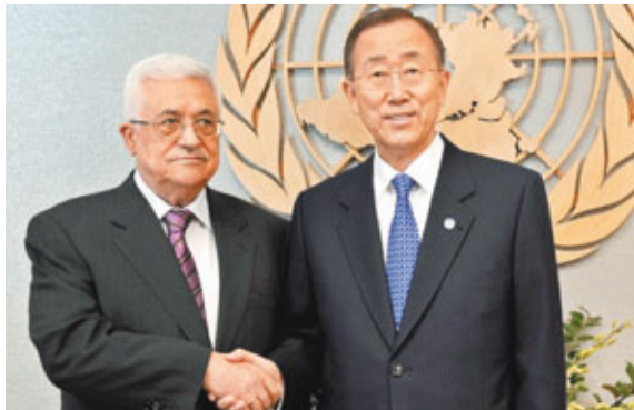
■阿巴斯(左)在聯合國大樓與潘基文會面。