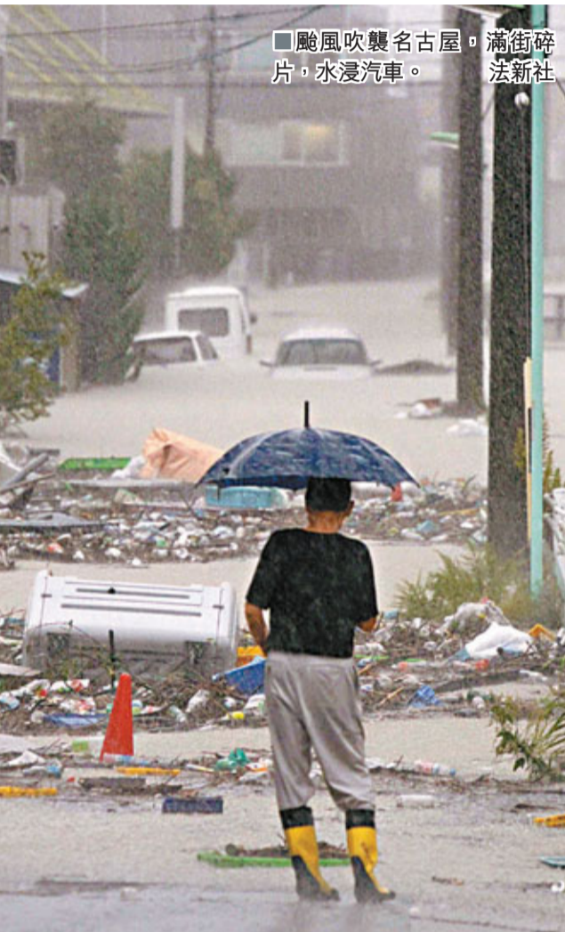
■颱風吹襲名古屋，滿街碎片，水浸汽車。