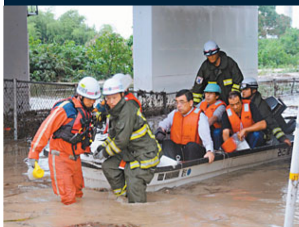
■名古屋部分地區水深至腰，救援人員推船疏散被困災民。

日本多災多難！受早前颱風「塔拉斯」影響，和歌山縣的堰塞湖再因強烈颱風「洛克」來襲帶來暴雨，有決堤危險。受「洛克」帶來的洪水威脅，當局共向全國132萬人下令或建議疏散，當中名古屋的情況最危急，市內多條河流有氾濫之虞，108.8萬人被建議疏散。「洛克」昨掠過日本東南部海域，並以時速20公里向311大地震受災的東北部移動，可能威脅福島核電站。