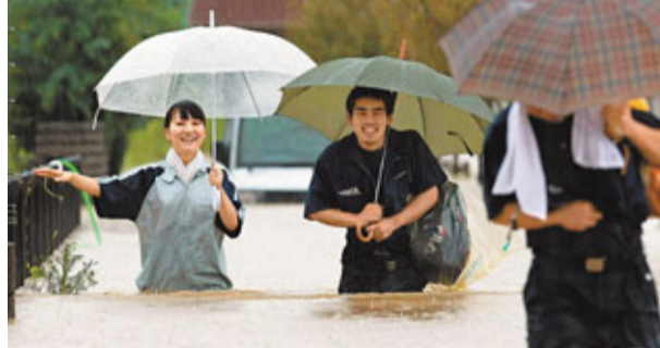
■災區民眾舉步維艱。