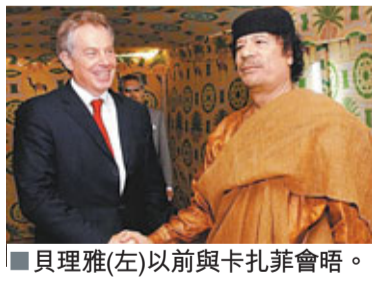
■貝理雅(左)以前與卡扎菲會晤。

英國早前被揭與利比亞「狂人」卡扎菲關係千絲萬縷，英國前首相貝理雅再被揭發曾在2008年致函卡扎菲，感激他盛情款待，並向他推介非洲投資項目。貝理雅此前已被揭發在釋放洛克比空難主犯邁格拉希前，曾兩度造訪利比亞，「每日郵報」揭露貝理