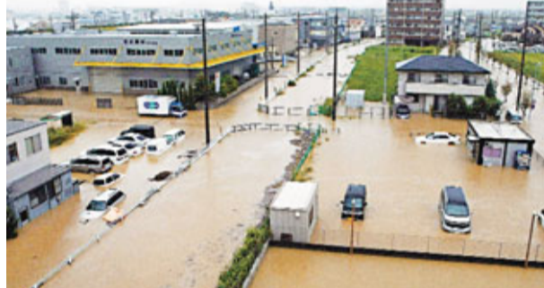
■名古屋街道如同澤國。法新社