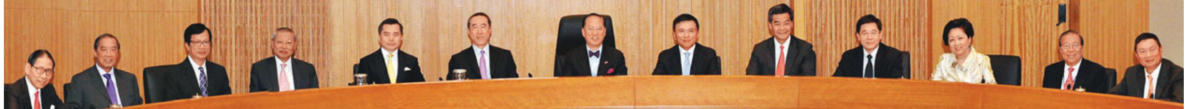
行政會議昨日在新政府大樓復會並全體合照，料梁振英將會最後一次以召集人身份參與。

香港文匯報訊（記者鄭治祖）公開表明正「備選」明年舉行的新一屆特首選舉的特區行政會議召集人梁振英，昨正式向特首行政長官曾蔭權請辭並獲得接納。梁振英表示，自己需要數天到一個星期的時間，將手頭上的工作處理完，才會正式離開行政會議，但他未有明確表示此舉是否意味他會正式參選。特首發言人指，行政長官是在昨日上午行會開會前獲悉梁振英要辭職的意向，並在原則上接納，但梁振英離開行會的具體時間表仍有待商討。