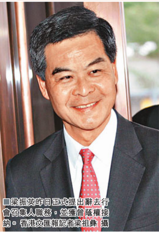
梁振英昨日正式提出辭職去行政會議召集職務，並獲曾蔭權接納。

香港文匯報訊（記者鄭治祖）公開表明正「備選」明年舉行的新一屆特首選舉的特區行政會議召集人梁振英，昨正式向特首行政長官曾蔭權請辭並獲得接納。梁振英表示，自己需要數天到一個星期的時間，將手頭上的工作處理完，才會正式離開行政會議，但他未有明確表示此舉是否意味他會正式參選。特首發言人指，行政長官是在昨日上午行會開會前獲悉梁振英要辭職的意向，並在原則上接納，但梁振英離開行會的具體時間表仍有待商討。