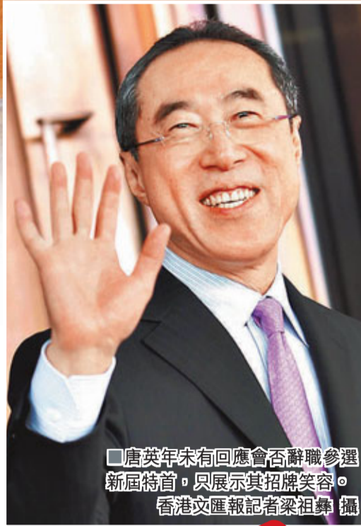
唐英年未有回應是否辭職參選新一屆特首，只展示其招牌笑容。