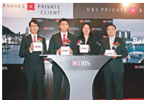
星展銀行昨日推出「星展豐盛私人客戶」。

東移的趨勢下，亞洲區富豪與日俱增，當中以內地客戶極具潛力。她指出，去年內地客戶約佔本港整體零售業務收入約1%至2%，預計10年後，內地客戶將佔港零售業務17%的收入，而該行亦冀於2020年時可達到此收入目標；而「星展豐盛私人客戶」可望佔星展香港零售銀行整體業務的三分之一。