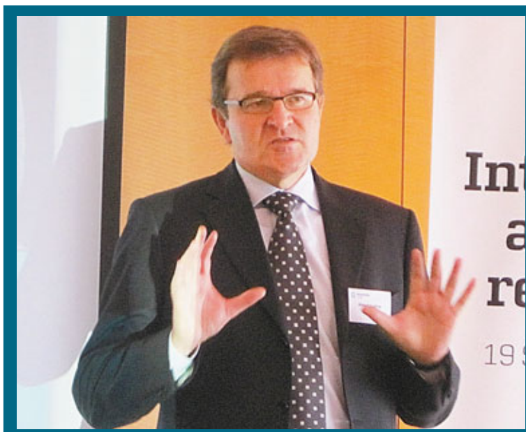
馬士基航運首席执行官柯林表示，歐洲航線今年表現尚可。

北美市場則錄得16.4%的升幅，直營店銷售額在12%的內部增長及淨新增17家店推動下，同比上升21%。批發渠道銷售額亦取得不俗表現，受惠於向美國百貨店交付量增加及消費市場整體復甦，期內同比增長9.7%。至於日本市場，雖然受到地震及海嘯衝擊，期內仍然表現穩健，集團品牌在當地的淨銷售額增長8.2%，淨新增3家店，內部增長幾近持平。