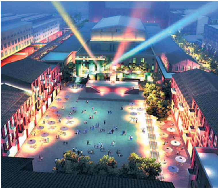
■成都東區音樂公園夜景效果圖。

三是音樂人才培養基地。以星工廠培訓基地為物理平台，廣泛通過選秀活動、交互式KTV周明星選拔、川音訓練基地和小型酒吧商演活動，發掘優秀藝人，並通過園區自有演出平台對藝人進行推介，使東