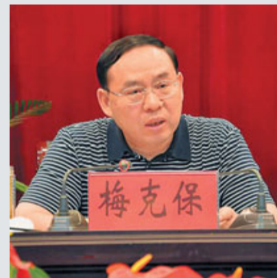
■湖南省委副書記梅克保在湖南省戰略性新興產業項目建設推進大會現場講話。

香港文匯報訊 (記者 譚錦屏、易新) 湖南省近日召開會議，總結近一年多來培育發展戰略性新興產業重點項目建設情況，部署下階段推進重點項目建設有關工作。省委副書記梅克保，省委常委、長株潭試驗區工委書記陳肇雄出席會議並講話。