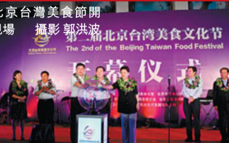
■北京台灣美食節開幕現場

香港文匯報訊(記者 鄭源源、郭洪波 北京報道) 9月8日，以「味覺印象·咫尺台灣」為主題的第二屆「北京台灣美食文化節」在北京石景山台灣街隆重開幕。本次美食節緊緊圍繞北京市打造國際商務中心，建設世界城市 and 加快北京西部地區發展的主基調，以營造CBD文化休閒氛圍，擴展北京台灣街商業品牌為目標，通過「台灣那碗、台灣那味、台灣那調」三個主題的特色活動，從台灣文化展示、台灣美食品嚐和台灣音樂欣賞等多角度展示台灣獨特風情元素，打造吃、喝、玩、樂、購一站式的台灣休閒體驗。