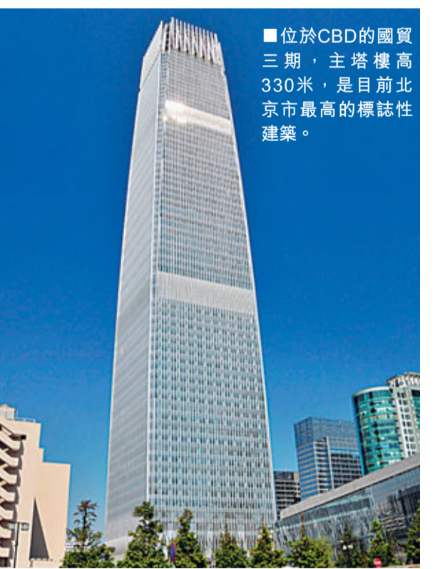
■位於CBD的國貿三期，主塔樓高330米，是目前北京市最高的標誌性建築。

按照規劃，CBD核心區內共有18棟樓宇，多個樓宇樓高超過100米，未來這組建築物將成為首都的地標性建築群。將於2015年完工的CBD核心區地下公共空間，具有51萬平方米