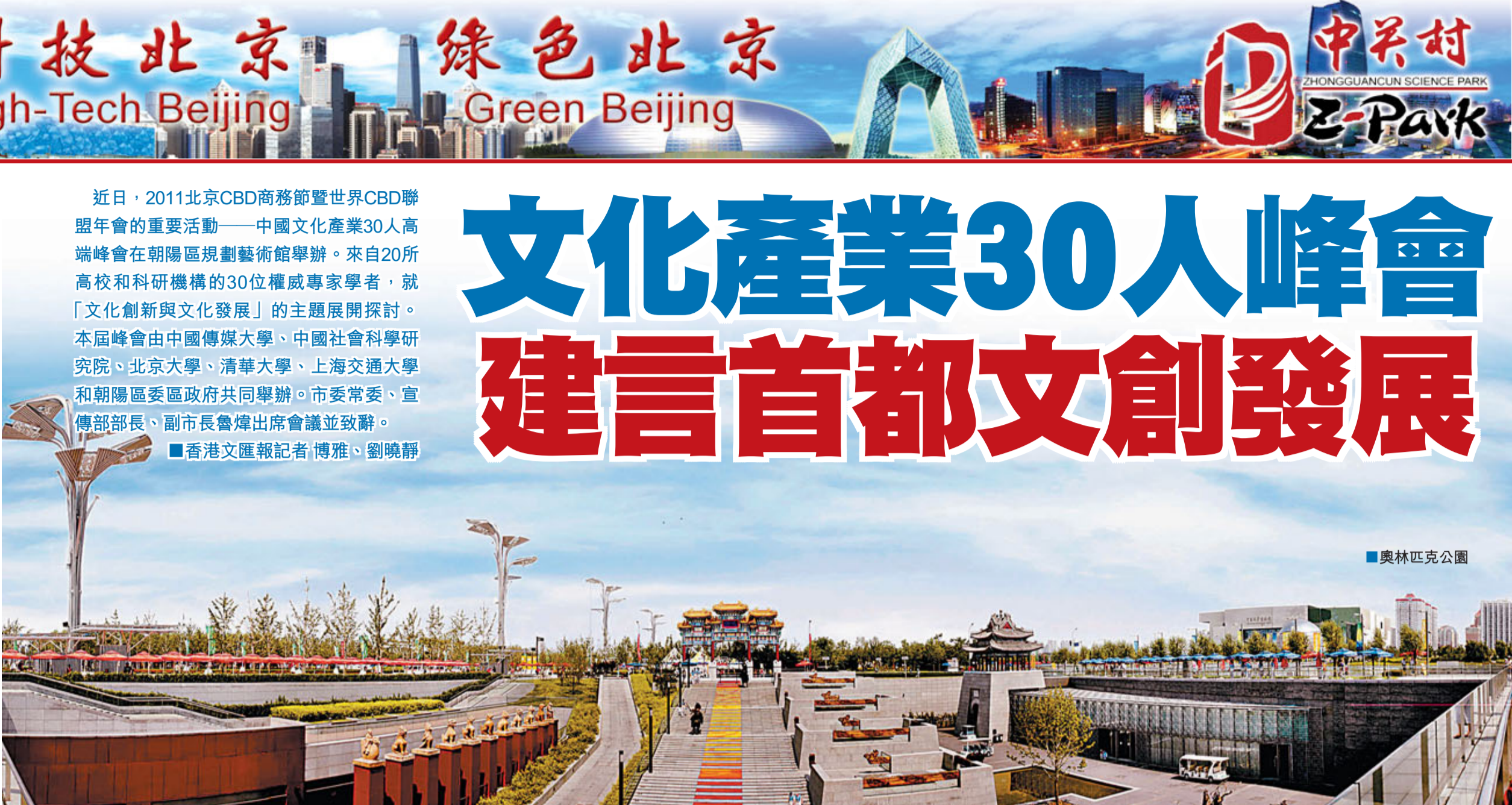
■香港文匯報記者 博淮、劉曉靜

金近80億元；小額貸款公司4家，註冊資本3.7億元。區內已聚集了國內外知名股權投資基金管理公司41家，包括法人機構38家，代表處3家。金融機構正式簽約入駐位於朝陽區的北京商務中心區(CBD)。至此，入駐北京朝陽區的金融機構總數也增至1244家。其中，法人金融機構236家；外資金融機構258家，佔全市近70%。截至7月底，朝陽區金融業實現稅收92.2億元，年底前有望達到百億元。 此外，北京CBD核心區招投標結果近期已經公佈，多家國內外重量級金融總部、標誌性金融機構實現中標，預計將有40-60家國際金融機構總部位於該區。國際金融機構加速向北京CBD聚集，金融效率明顯，區域國際金融影響力和承載力大幅提升，為首都加快產業結構調整、轉變經濟發展方式、主導產業快速聚集注入新的活力。