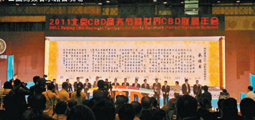
■圖為簽署承諾書現場

全國政協副主席鄭萬通、國家商務部副部長姜增偉、國務院僑辦副主任任啟亮、北京市副市長程紅、北京市政協副主席趙文芝、世界商務區聯盟秘書長安德烈·布蘭、朝陽區副書記陳剛等領導共同啟動了開幕式。 開幕式上，中國國際期貨有限公司、陽光保險(集團)有限公司、三星生命保險株式會社、中國國際金融有限公司、中國民生銀行股份有限公司等即將入駐北京CBD的企業，在開幕式上共同簽署了「低碳發展」承諾書。企業承諾將從「堅持低碳理念、精準國際一流、履行節能減排」三方面，在企業樓宇項目開發過程中，以國際先進的綠色設計理念為主導，採用節能環保材料，加強對可再生能源和再生水資源的利用，將CBD核心區建設成為北京市乃至全國領先的低碳、綠色、環保示範區。