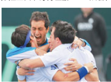
意大利隊在戴維斯盃中獲勝晉級世界組後相互擁抱慶祝。