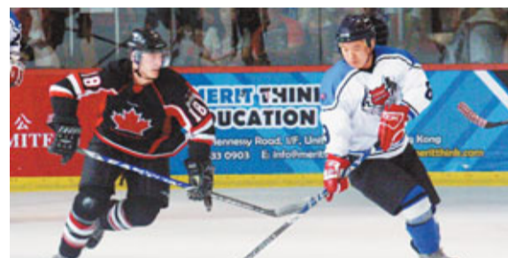
浩泰球員正嘗試突破對方防守。

經過分組賽、複賽的賽事後, 溫哥華公牛隊與北京浩泰隊雙雙晉身金盃決賽, 爭奪今屆賽事的最高榮譽。金盃決賽上半場, 浩泰與公牛互相展開激烈進攻, 兩隊球員都曾多次嘗試突破對方守門員。惟雙方龍門皆防守嚴密, 至使上半場遲遲仍未取得「零的突破」。浩泰隊一名球員更因急於突圍, 在臨完場前2分鐘犯規, 被球證判罰離場。下半場賽事漸趨激烈, 公牛隊在開賽不久便射入首個入球。當公牛正打算再下一城, 賽事卻有戲劇性發展。浩泰因不滿球證對公牛隊犯規的判決而憤然離場, 更一度揚言罷打比賽。經過10多分鐘的冷靜, 有體育精神的浩泰隊決定再次踏足冰場, 完成餘下賽事。可是, 浩泰隊的整體心情很明顯