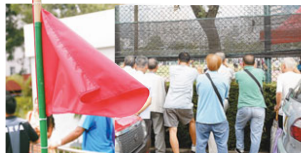
因全場爆滿, 不少球迷只能在場外窺探場內戰況。

香港文匯報訊 (記者 郭正謙) 南華昨日在全場爆滿的深水埗運動場成功打開今季勝利之門! 在2185名球迷入場支持下, 昨日的深水埗運動場出現今季首面象徵全場滿座的紅旗, 南華憑藉早段戴倫及蘇沙的入球以2:0擊敗深水埗, 取得本季首場勝仗。