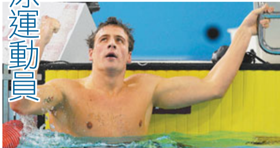
美國泳壇新秀羅切特獲選為美國年度最佳游泳運動員。