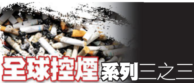
全球控煙系列三之三