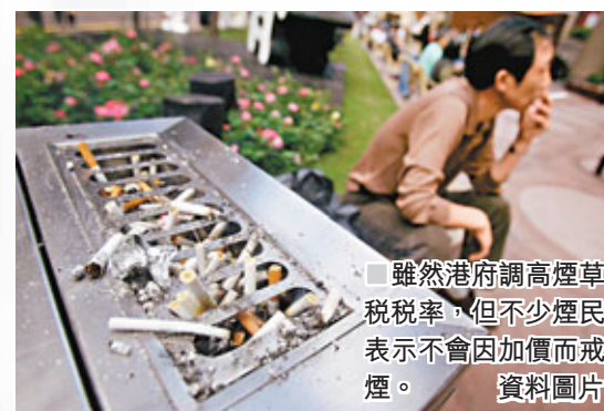
雖然港府調高煙草稅率，但不少煙民表示不會因加價而戒煙。

一些國家針對上述問題，實施更嚴厲的措施，包括禁止未成年人士購買(Purchase)、使用(Use)及藏有(Possess)煙草產品，一般稱為PUP法例。美國是實施這類措施較為廣泛的國家，幾乎所有州皆有類似法例，不過罰則因州份而有別。大致上，罰則以罰款最為普遍，亦有沒收搜獲的煙草產品、強制接受相關教育、暫停駕駛執照、社會服務令，以至監禁等。