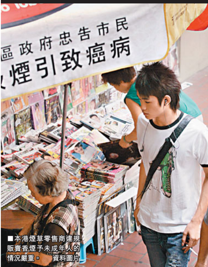
■本港煙草零售商違規販賣香煙予未成年人的情況嚴重。