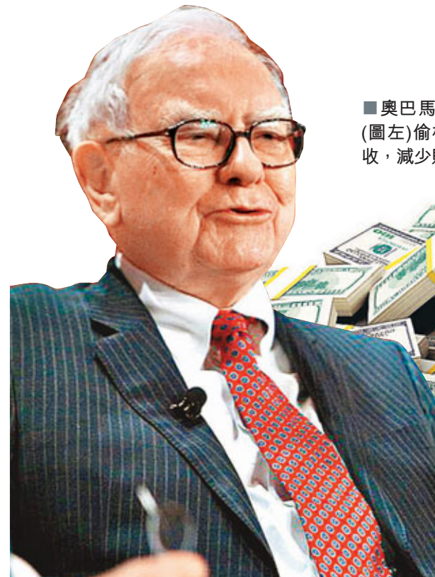
■奧巴馬(圖右)向巴菲特(圖左)偷橋，期望增加稅收，減少財赤。

美國「股神」巴菲特上月在《紐約時報》撰文，表示美國富豪交稅比中產納稅人更少，這番言論看來為力求削減聯邦赤字之總統奧巴馬獻上計策。奧巴馬今天將宣布，建議向富豪徵收額外稅款，確保他們至少與中產納稅人所負擔的稅率相同。然而，由於共和黨拒絕加稅減赤的計劃，預計「巴菲特稅」方案將在國會觸礁。