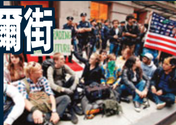
■示威者中不乏年輕人。

紐約警方當天封鎖臨近紐約證券交易所及聯邦議會大廈的所有道路，就連華爾街的標誌銅牛像也被完全封鎖起來，內外均有眾多警察把守，氣氛格外緊張。不少示威者對警方完全封鎖華爾街惱怒不