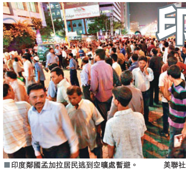
印度鄰國孟加拉居民逃到空曠處暫避。

印度東北昨晚6時10分(香港時間昨晚8時40分)發生黎克特制6.8級強烈地震，其後再發生多次餘震，最強一次達6.1級。錫金邦首府甘托克有10多幢建築物倒塌，在印度造成至少5死25傷，據報包括1名小童，印度東部、北部廣泛地區及首都新德里均有明顯震盪。中國西藏拉薩及日喀則地區亦感到震動，部分房屋倒塌，不少居民逃到空曠處暫避。鄰國尼泊爾據悉有5人死亡。