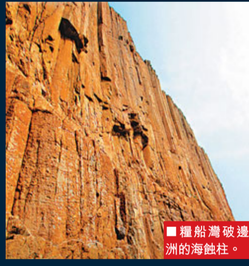
■ 糧船灣破邊洲的海蝕柱。

由 聯合國教科文組織支持的世界地質公園網絡,於挪威時間9月17日,在當地的朗厄舉舉行第10屆歐洲地質公園會議上宣布,接納香港國家地質公園加入為該網絡的最新成員。特區政府隨即宣布,香港地質公園正式命名為「中國香港世界地質公園」。世界地質公園網絡目前在27個國家擁有87個成員,遍佈歐洲、亞洲、南美洲、澳洲、中東及北美洲,當中包括內地黃山、日本洞爺湖火山、韓國濟州島等。