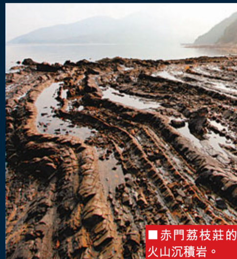
■ 赤門荔枝莊的火山沉積岩。