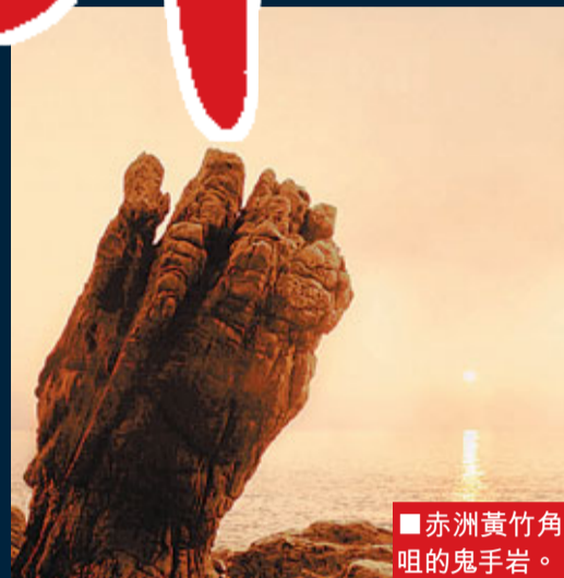
■ 赤洲黃竹角咀的鬼手岩。