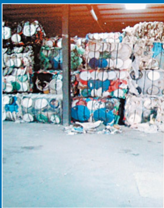
警犬協助在回收場內的廢料堆中搜索毒品。