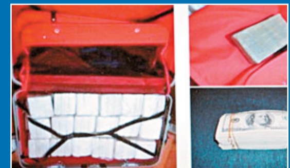
警方在毒梟的拖兜檢獲部分可卡因及美鈔。