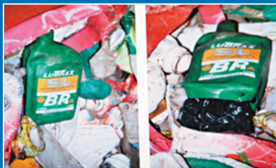
毒梟將偽油膠瓶開用以收藏可卡因。