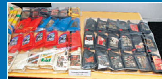
被毒梟利用藏毒的偽油膠瓶。