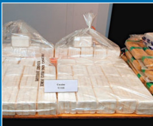
警方檢獲的可卡因磚。

根據禁毒處資料，去年21歲以下青少年吸食可卡因人數，比前年激增近5成；有註冊社工更表示，單於新界西北區，青少年吸食可卡因而求助的個案亦已急增一倍。禁毒處表示會藉校園驗毒計劃，向學生加強遠離毒品的宣傳教育。