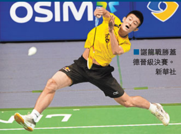
諶龍戰勝蓋德晉級決賽。

香港文匯報訊(記者 陳曉莉) 2011年中國羽毛球大師賽17日在常州結束準決賽爭奪。東道主中國隊在女單、男單及女雙三個項目上形成壟斷局勢，包攬了該三個項目的所有決賽席位。其中，上屆男單亞軍、年僅22歲的中國小將諶龍以21:18、21:14淘汰丹麥名將蓋德更成為一時佳話。