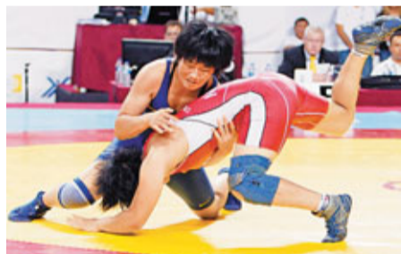
西洛卓瑪(藍衫)在比賽中。

香港文匯報訊(記者 陳曉莉) 2011年世界摔跤錦標賽香港時間17日在土耳其伊斯坦布爾舉行，中國選手西洛卓瑪在女子自由式摔跤67公斤級比賽中為中國隊奪得本屆世錦賽的首枚金牌。西洛卓瑪在第一輪戰勝美國選手格雷伊，隨後又淘汰加拿大的杜克雷涅爾及東土耳其選手奧斯卡婭而躋身決賽，決賽中她又力克蒙古選手班扎格策而獲得冠軍。