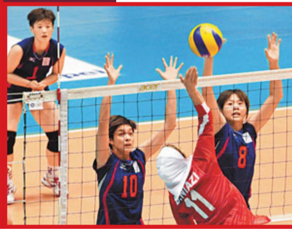
中華台北隊攔截伊朗隊的進攻。

亞錦賽都在台大體育館進行，她則酷酷地說：「都是比賽，承受的壓力都一樣，沒甚麼改變。」