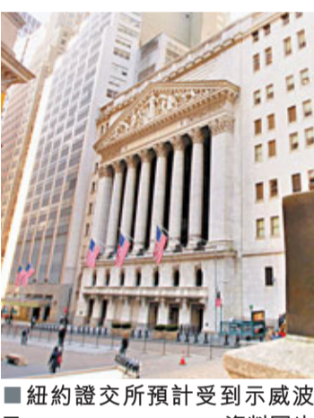
紐約證交所預計受到示威波及。

年初突尼斯「茉莉花革命」掀起北非及中東反政府示威潮，如今終於席捲美國？非牟利雜誌網站Adbusters在網上發起「佔領華爾街」活動，號召兩萬人在紐約曼哈頓紮營靜坐，並設立「和平路障」，聲討導致經濟危機的金融界「罪魁禍首」。據稱，全球74個城市亦會有人示威響應。