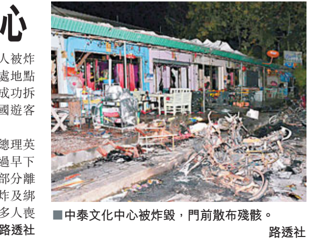
■中泰文化中心被炸毀，門前散佈殘骸。

爆炸發生於鄰近大馬路邊的那拉提瓦府同一條街上，一架停泊在中泰文化中心外的電車最先爆炸，其後兩家酒店外的電車及汽車亦相繼爆炸。