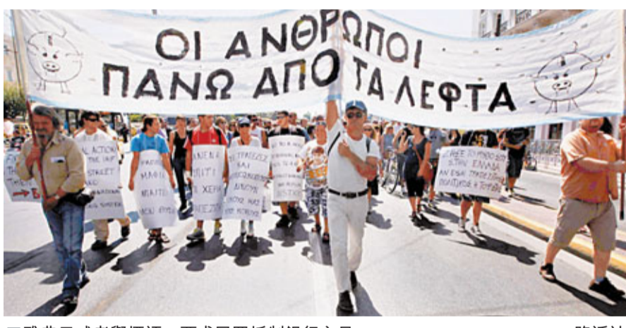
■雅典示威者舉標語，要求民眾抵制銀行交易。